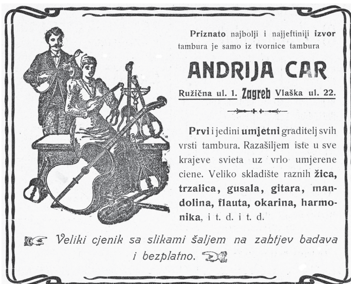
Reklama radionice iz 1908. godine

je Gjuro Štapa objavio oglas kako bi obavijestio svoje dotadašnje kupce o prese-ljenju radionice. Iz navedenog oglasa može se vidjeti da je Gjuro Štapa nastavio prodavati asortiman iz Radionice svoga pokojnog gazde Andrije Cara i nakon njegove smrti. Može se samo pretpostaviti da je na "lageru" ostalo viška gotovih instrumenata, uz nove, koje je izrađivao i popravljao. Ksaverska cesta 15 ujedno je i posljednja adresa radionice koja je postojala sve do 1. srpnja 1932. - kad je Gjuro Štapa konačno odjavljuje kod Obrtne oblasti ovim riječima: "Podpisani prijavljam Slavnoj Obrtnoj Oblasti u Zagrebu da moj obrt za izradu i prodaju tambura od 1. srpnja 1932 obustavljam i napuštam...". U potpisu stoji: "...Gjuro Štapa, radionica tambura, Ksaverska cesta kbr. 15...". Tako je privedena kraju bogata povijest Radionice Andrije Cara i njezinih nasljednika koja je neprekidno djelovala od 1894. do 1932.