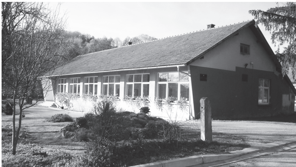
Područna škola u Šćepanju obrazovno-odgojnim radom započela je 9. studenoga 1958. godine.

U narednim se godinama područna škola u Šćepanju zajedno s okolišem podvrgnula uređenju, i to zahvaljujući agilnosti djelatnika škole i samih mještana.