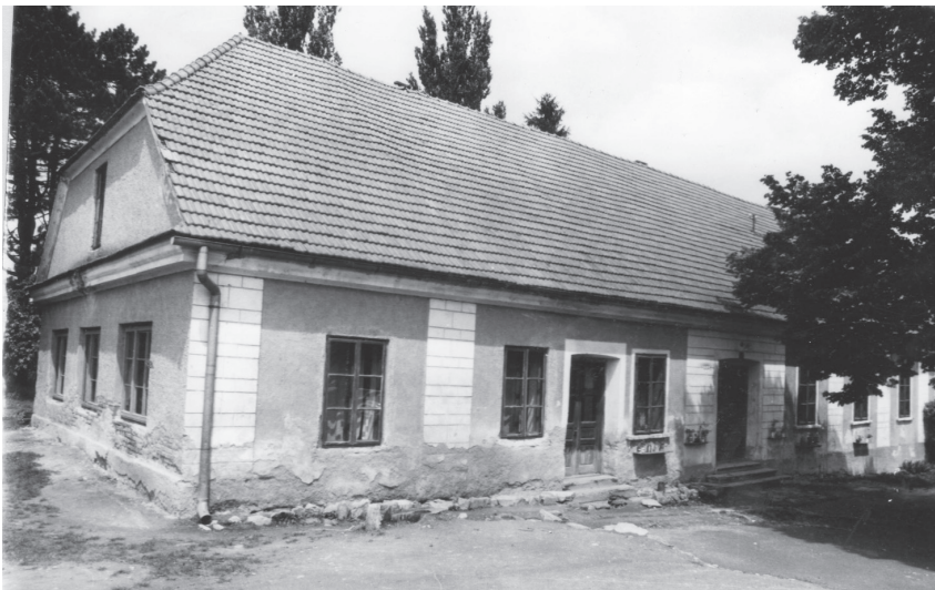
Školska zgrada u Breznici, snimljeno 1973. godine