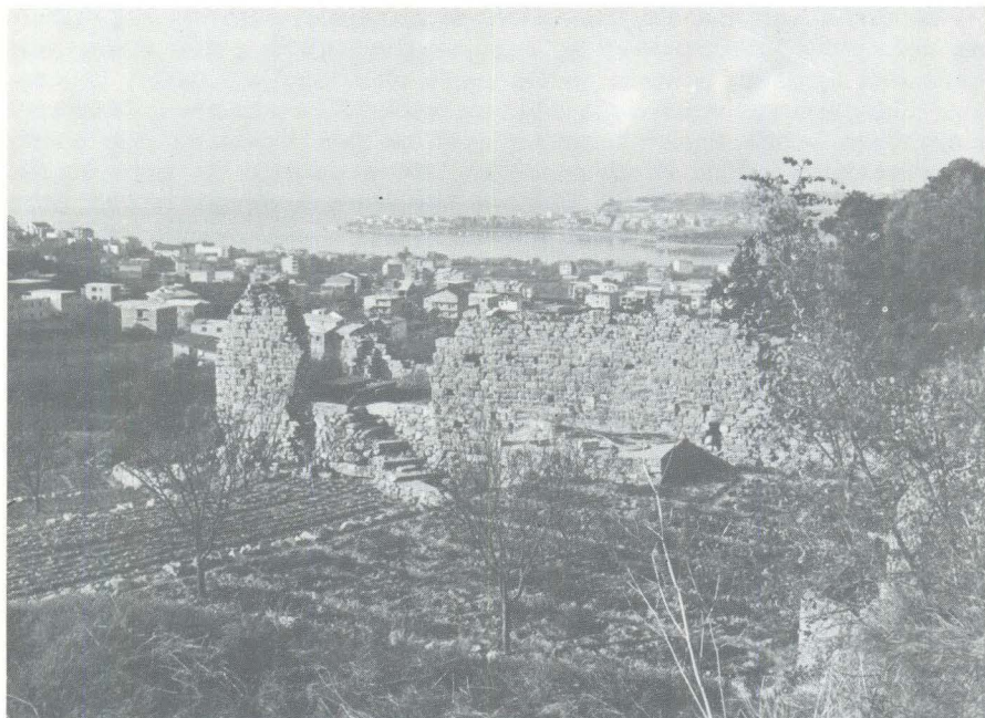
Ostaci rimske građevine u Polači kod Strožanča

Ausonius je i Dalmatiarum consulens . Oblik consulens je neuobičajen i nisam ga mogao pronaći u dostupnoj mi literaturi. Nema ga ni kod Dessaua, a ni kod Küblera u njegovim člancima consul i consularis . Vjerojatno ga treba shvatiti u istom značenju kao i consularis . 21 U vrijeme principata je consularis u pravilu onaj koji je već vršio konzulsku službu, a u Notitia dignitatum consularis znači namjesnika pokrajine. Consulens je možda i koruptela klesara ili je to supstantivirani particip, jer je Ausonije i bio u toj funkciji kada je natpis isklesan.