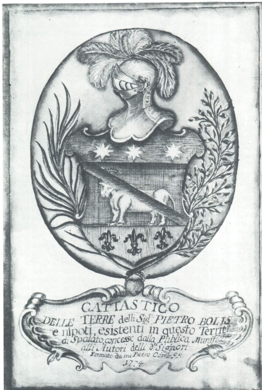
Grb obitelji Bolis u katastru iz 1774. g.