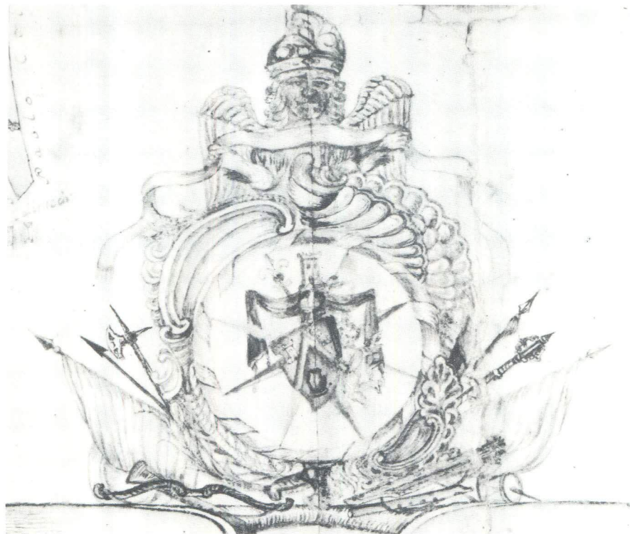
Grb obitelji Macukat iz 19. stoljeća

Uz ime nadintendanta pukovnika Stjepana na rodoslovnom stablu piše da je zajedno s braćom 1768. bio primljen u plemstvo Omiša. 33 Taj podatak potvrđuje ovjereni prijepis zapisnikâ Malog i Velikog vijeća Omiša koji se također nalazi u splitskom Arheološkom muzeju. Iz njega se vidi da je Malo vijeće 5. XII 1768. razmatralo molbu braće Matije, 34