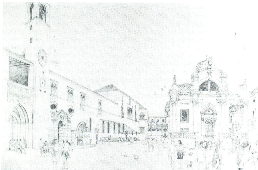
Idejna rekonstrukcija Vijećnice iz 15. st. u Dubrovniku (crtež L. Delfin)

Danas pak kada nam se pružila zgoda njenog uklanjanja iz zaokružene sredine kojoj se nametnula i povrijedila je, Dubrovčani okupljeni u radinom i zaslužnom »Društvu prijatelja dubrovačke starine«, koja već trideset godina uspješno djeluje na zaštiti i obnovi dragocjene spomeničke baštine, traže njeno premještanje i obnovu stare Vijećnice.