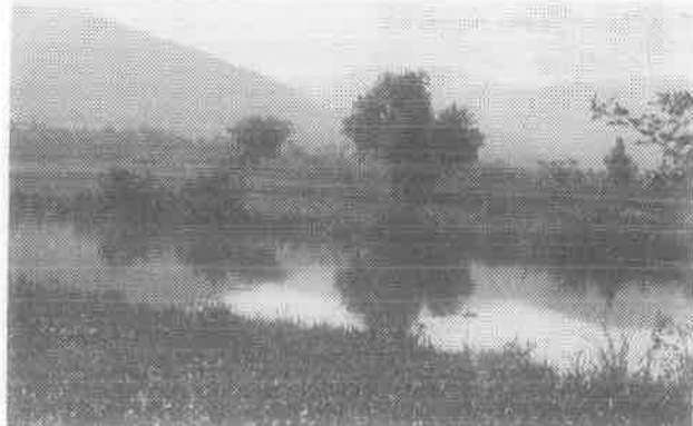
Krka — izvorni dio