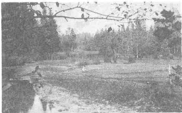
Ribnjak Logater — puštanje vode

Početak jula ženki smo oduzeli jaja, jer su imala već prilično suhi vez, kojim su pričvršćena na nožice. Veličina ženke bila je 10,6 cm. Imala je samo 295 jaja, s promerom 2,5 mm. Jaja smo namestili u samovalilnik, koji je bio opremljen još s plutom, da je plivao. Pričvrstili smo ga granom pod vrbov grm u senki ribnjaka. Nakon 460 dana dobili smo prve račiće, a ostale nakon 598 dana kod temperature 23°C u julu mesecu.