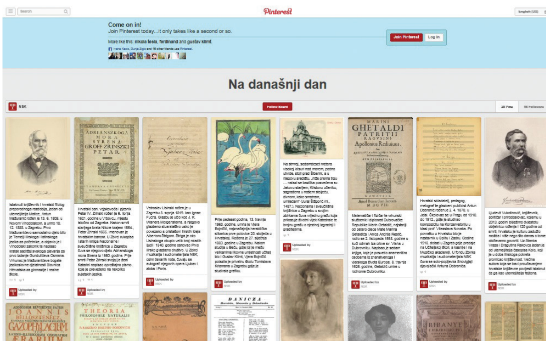
Slika 5 – Album Na današnji dan na Pinterestu

Višegodišnje iskustvo sustavnoga obilježavanja obljetnica na portalu i društvenim mrežama Knjižnice pokazalo je kako su takve objave zanimljive i korisne raznovrsnom profilu korisnika, od školaraca i studenata, do profesora i svih željnih znanja, a vidljivo je i kako imaju bitnu ulogu u promicanju Knjižnice i njezina fonda. Riječ je o sadržaju koji će uvijek naći put do čitatelja, no potrebno je osluškivati i prihvaćati potrebe korisnika, koje se u virtualnome okruženju neprekidno mijenjaju, jer su zadovoljni korisnici najbolji pokazatelji uspješnosti.