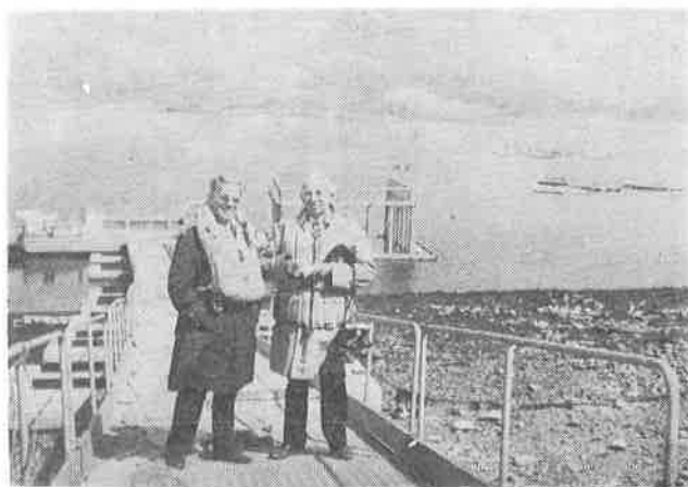
Marine Harvest LTD. Lochailort, Arguyu Prof. Hues (Belgija) i Prof. K. Apostolski (Yugoslavija) pregledaju instalacije za uzgoj riba u kavezima.

20 kg/m 3 , pri koeficijentu hrane od 3. (za 1 tonu, prema podacima Nr. R. Bradley, direktora Stanice cena hrani je cca 300 odnosno cca 10 din/kg). Svakako, ovi rezultati ukazuju na nove mogućnosti ekspanzije akvakulture i neograničene mogućnosti povećanja riblje produkcije, uz uslov da se u međuvremenu razreše problemi iznalaženja jeftinih sirovina za izradu peleta za ribe.