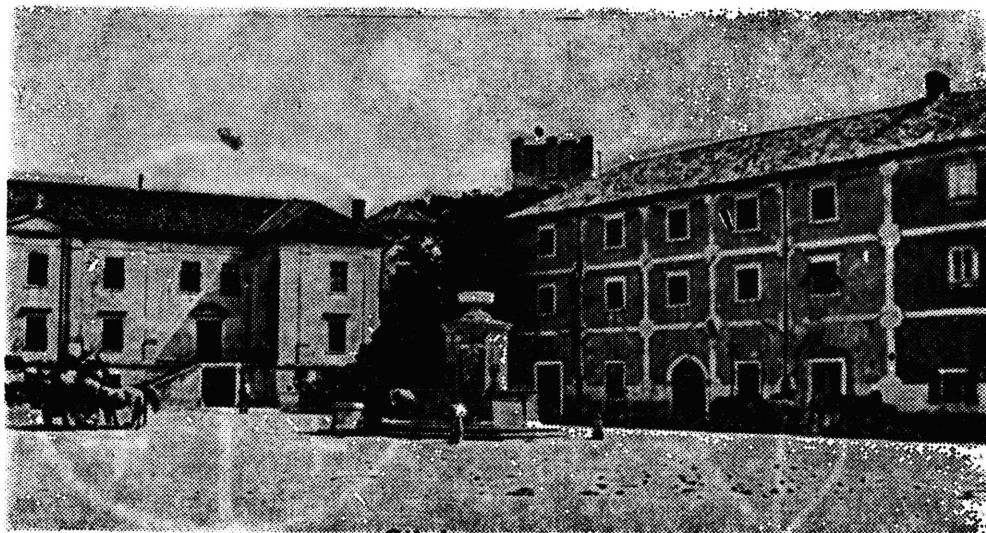
Sl. 118 — Trg Marka Balena — Cilnica, desno kuća Demelli (ex Scarpa). Snimak iz vremena oko 1930.

Der Plan dieses Hauses von Mattheus Schrotbauer aus dem Jahre 1785 stellt ein wertvolles Beispiel der Architektur aus dem 18. Jahrhundert im historischen Stadtkern von Senj dar.