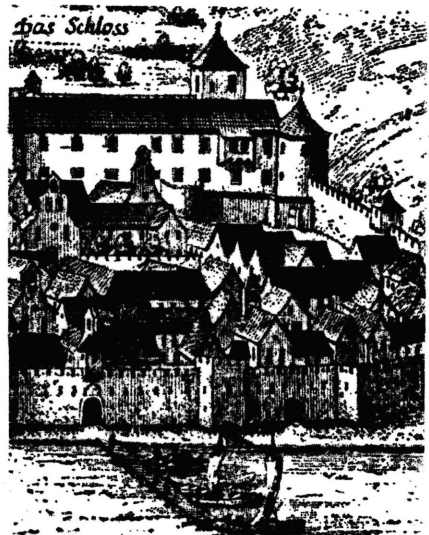
Sl. 117 — Detalj Kaštela i starih Velikih vrata sa slike Valvasora