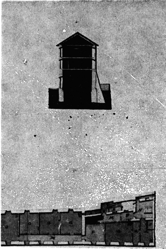
Sl. 116 — Plan pročelja, presjek i tlocrt kuće Jurja Demellija od Löwensfelda na senjskoj Cilnici. Arhitektonski snimak Mattheus Schrotbauer, Architectus, Senj, 31. svibnja 1785.