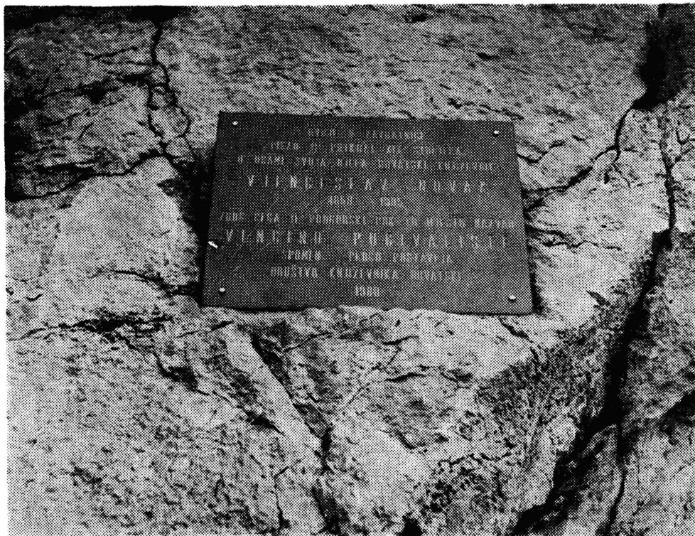
Sl. 180 — Književniku Vjenceslavu Novaku u zaljevu Zavratinica kod Jablanca, na mjestu »Vencino počivalište« postavljena je 1980. spomen-ploča

OVDJE U ZAVRATNICI PISAO JE POTKRAJ XIX STOLJEĆA U OSAMI DJELA HRVATSKI KNJIŽEVNIK VJENCESLAV NOVAK 1859 — 1905. ZBOG ČEGA JE PODGORSKI PUK TO MJESTO NAZVAO » VENCINO POČIVALIŠTE « SPOMEN PLOČU POSTAVLJA DRUŠTVO KNJIŽEVNIKA HRVATSKE 1980.