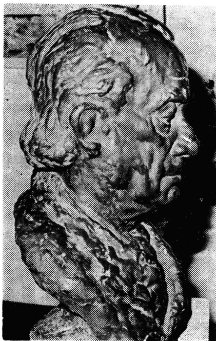
Sl. 185 — Poprsje Dr Ivana Ribara, rad kipara Ivana Vukušića