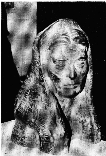
Sl. 186 — Portret žene — majke, rad kipara I. Vukušića