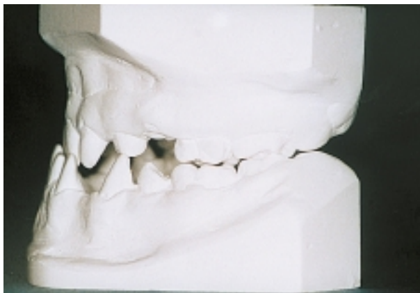
Slika 2. Početno stanje - okluzija s lateralne projekcije Figure 2. Initial condition - lateral view