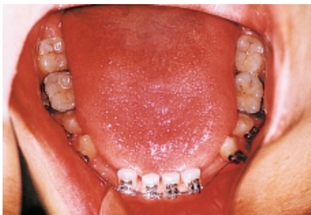
Slika 6. Fiksni aparat - donji zubni luk Figure 6. Initial phase of treatment - lower fixed appliance