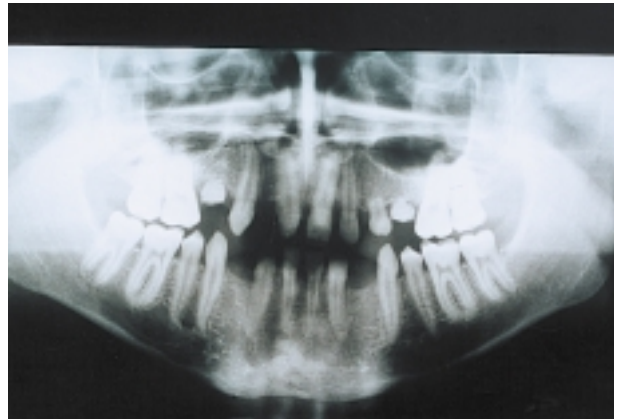
Slika 4. Ortopantomogram - dentalni status Figure 4. Panoramic X-ray

U sagitalnoj dimenziji, na prvim molarima nalazimo klasu II, (rekonstrukcijom I) te obrnuti prijelom sjekutića.