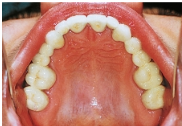
Slika 11. Protetska konstrukcija u gornjoj čeljusti Figure 11. Prosthetic construction in the upper jaw