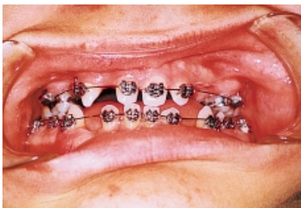
Slika 7. Fiksni aparat u oba zubna luka Figure 7. Initial phase of treatment - appliance in both jaws

biven kongruentni okluzijski odnos, a postignut je i normalni prijeklop sjekutića.