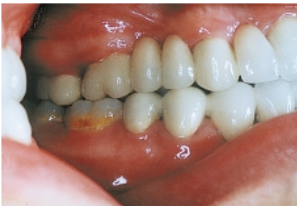
Slika 15. Okluzija - desna postranična projekcija Figure 15. Complete prosthetic construction - right lateral view

vizijom konačnog rješenja. Ove je uvjete moguće zadovoljiti jedino multidisciplinarnom suradnjom u kojoj najčešće sudjeluju specijalisti: ortodont, pedodont, oralni kirurg i protetičar (5).