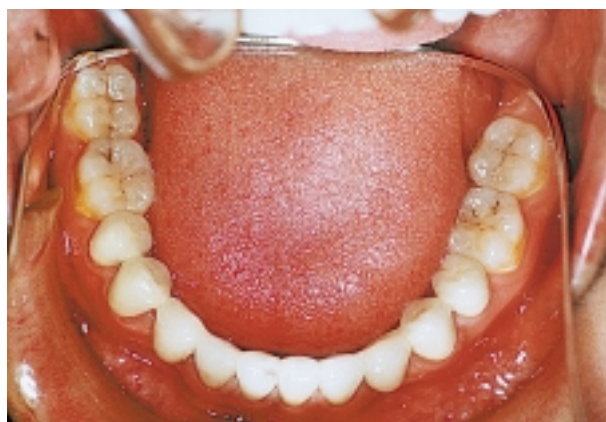
Slika 12. Protetska konstrukcija u donjoj čeljusti Figure 12. Prosthetic construction in the lower jaw

12, 23, 24, 25). Uključivanjem u most drugih molara obostrano dobivena je adekvatna visina zagriža i stabilnija okluzija u području molara (Slika 11).