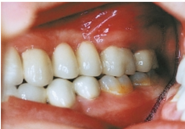
Slika 14. Okluzija - lijeva postranična projekcija Figure 14. Complete prosthetic construction - left lateral view