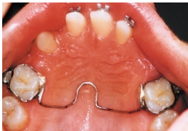
Slika 8. Palatinalni luk Figure 8. Palatal arch