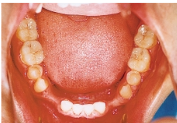
Slika 10. Donji luk nakon što je aparat uklonjen Figure 10. Lower jaw after orthodontic treatment