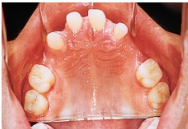
Slika 9. Gornji zubni luk nakon što je aparat uklonjen Figure 9. Upper jaw after orthodontic treatment