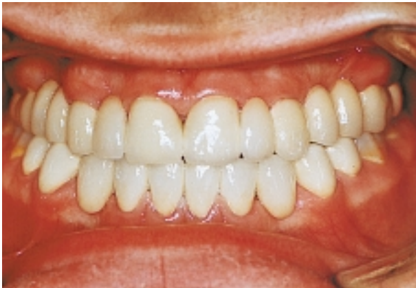
Slika 13. Okluzija - frontalna projekcija Figure 13. Complete prosthetic construction - occlusal view