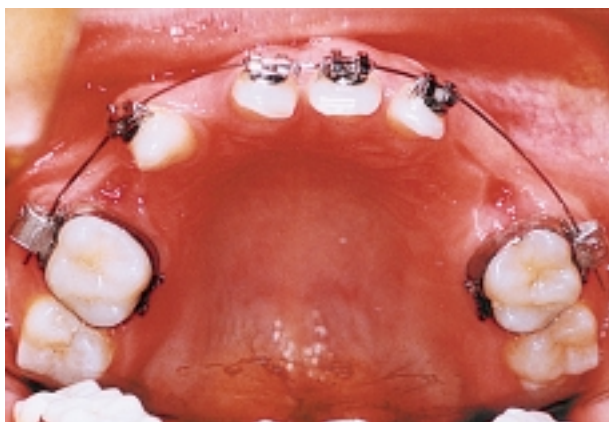
Slika 5. Fiksni aparat - gornji zubni luk Figure 5. Initial phase of treatment - upper fixed appliance