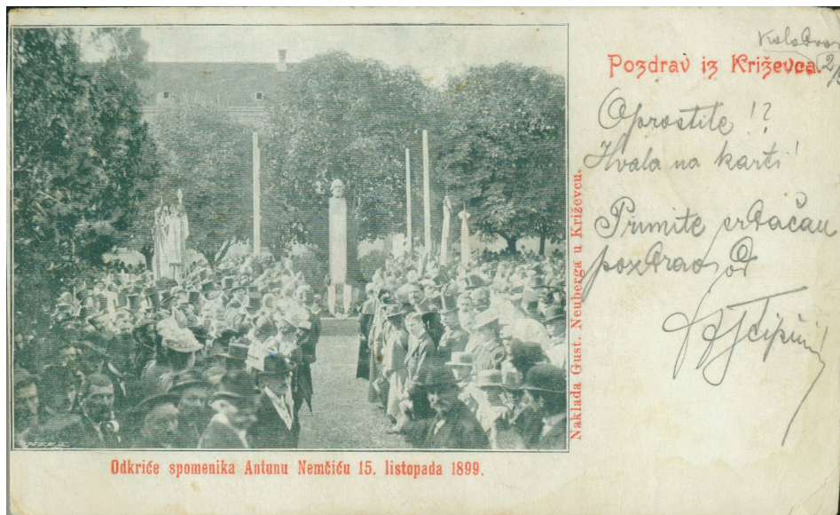
Slika 5. Razglednica Otkriće spomenika Antunu Nemčiću 15. listopada 1899. (Gradski muzej Križevci – GMK-455 7).

pa Julija Drohobeczskog, 32 baruna Ljudevita Ožegovića, 33 Huga Badalića, 34 Andriju Lenarčića, 35 narodnog zastupnika Stražića itd. Dr. Crkvenac održao je kraći govor