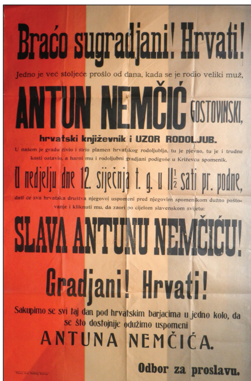
Slika 7. Plakat za obilježavanje 100. godišnjice Nemčićeva rođenja (Gradski muzej Križevci – GMK-7266).

Dva događaja kojima su Križevčani odali počast pjesniku Antunu Nemčiću u mnogočemu se razlikuju. Svečanost otkrivanja spomenika 1899. godine bila je izniman društveni i kulturni događaj kojem su prisustvovali brojni uglednici iz političkog, društvenog, napose kulturnog života. Razna pjevačka društva iz čitave sjeverozapadne Hrvatske pristigla su u Križevce kako bi prisustvovali