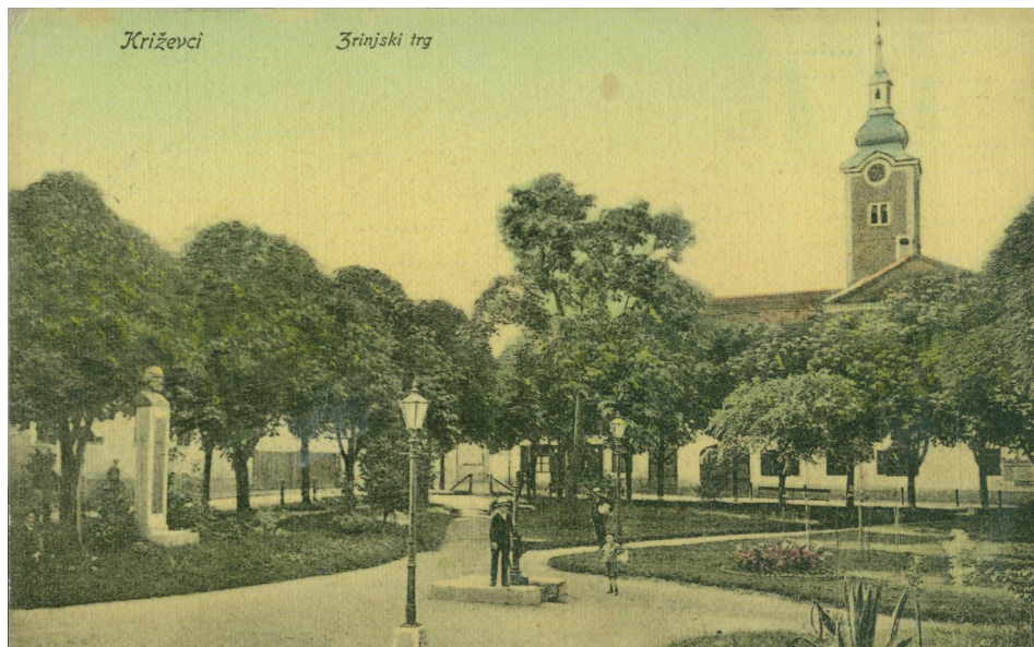
Slika 6. Razglednica Zrinjskog trga (danas Nemčićev trg) nakon podizanja spomenika