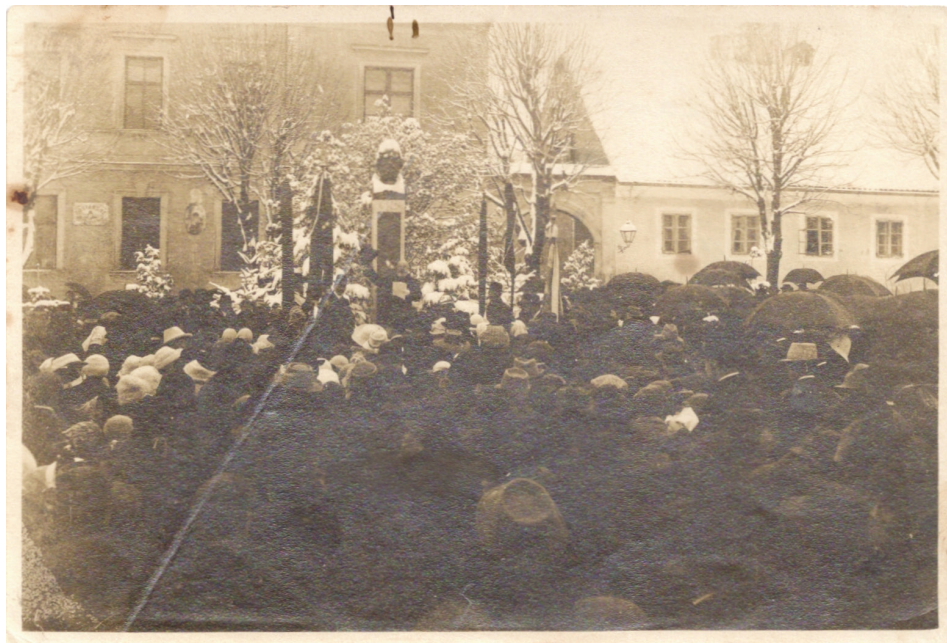
Slika 8. Fotografija govora dr. Frana Gundruma na obilježavanju 100. godine Nemčićeva rođenja (Gradski muzej Križevci – GMK-6643).

la pompoznom otkrivanju spomenika. Očigledno je da su i sami Križevčani tih godina veoma držali do Nemčićeve slave i ugleda. Tadašnje novine naveliko su najavljivale otkrivanje spomenika i pisale o njemu kao iznimnom događaju. No, već nakon nešto više od 13 godina situacija se uvelike izmijenila. Na obilježavanje stotog Nemčićeva rođendana nije bio pozvan (ili barem nije došao) nitko osim Križevčana i stanovnika okolnih sela. Iako je okupljeno mnoštvo bilo i ovaj put brojno, možda čak i brojnije nego 1899. godine, primjetan je nedolazak predstavnika političke vlasti, pa čak i uglednih kulturnih radnika. Ni novinski natpisi nisu ni približno toliko česti kao prilikom otkrivanja spomenika, čak bi se moglo reći da se više pisalo o kazališnim predstavama koje su se tih dana odigravale u Zagrebu u čast Nemčićeve 100. godišnjice rođenja. Razlog skromnijoj proslavi vjerojatno leži u općoj političkoj situaciji u Hrvatskoj u to vrijeme te činjenici da je trajao i Drugi balkanski rat. Ipak, Križevčani su se oba puta sjetili svog znamenitog sugrađanina i odali mu poštovanje kakvo zaslužuje iako je u njihovu gradu živio tek kratko vrijeme.