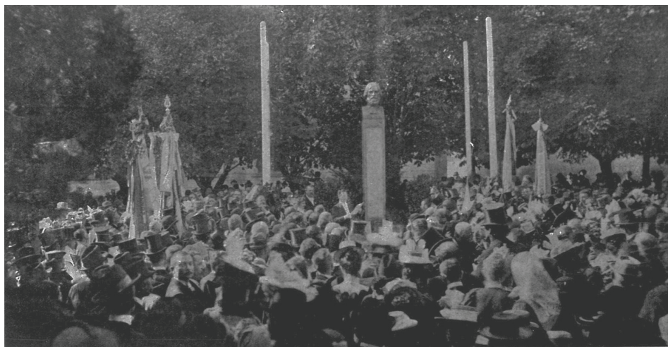
Slika 4. Odkriće Niemčićeva spomenika – fotografija iz časopisa Dom i svijet od 15. studenog 1899. (br. 22., str. 427.).

Milena pl. Šugh 28 izvela pjesmu Antunu Nemčiću Mihovila Nikolića a na kraju su sva pjevačka društva zajedno otpjevala pjesmu Na grobu Vilka Novaka. 29