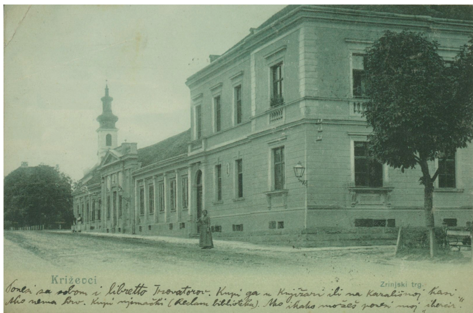
Slika 2. Razglednica s prikazom nekadašnje Narodne čitaonice.