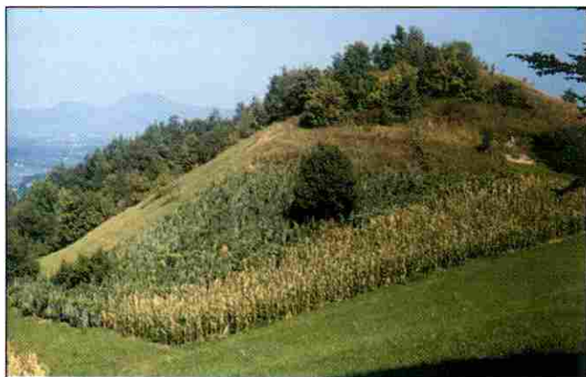
Slika 2. Pogled na arheološki lokalitet Špičak- Gradina I. i II. u tijeku iskopavanja