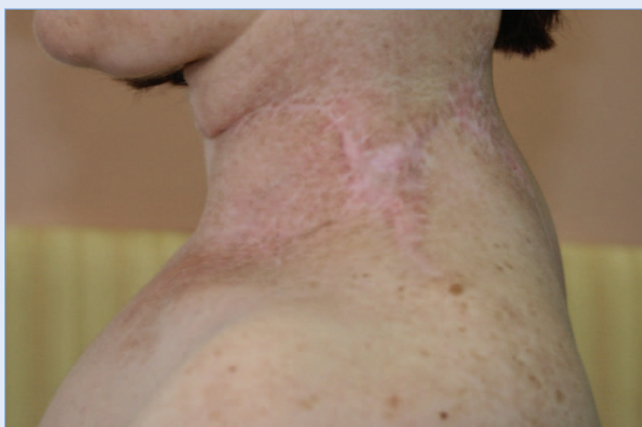
Slika 5. Uredan poslijeoperacijski lokoregionalni nalaz.

preparatu se obično uvijek nađu područja benignog spiradenoma. Diferencijalno dijagnostički važno je razlikovati benigni od malignog ekrinog spiradenoma. Imunohistokemijski spiradenokarcinom pozitivan je na većinu citokeratina, CEA, EMA, S100, pokazuje pojačanu ekspresiju p53 gena 6 . U malignom tumoru zabilježene su TP53 mutacije, dok nisu prisutne kod benignog spiradenoma.