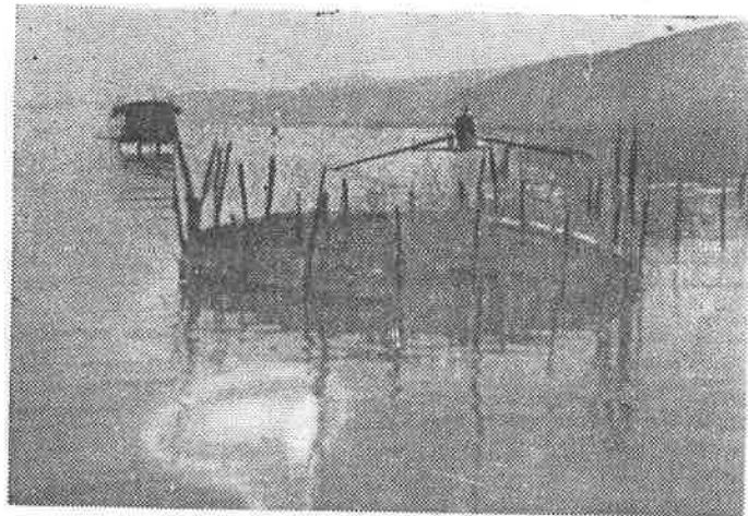
Kotec (iz ograde riba je konačno zbijena u kotec)

Istovremeno se vrše pripreme za »ograde« i »gradeže«. Najpre se do korena iseče trska od obale ka kolibi dva metra široko, dobivajući tako kanal, koji veže kolibu sa obalom. Zatim ribari svoje reone ograđuju kolcima i le-