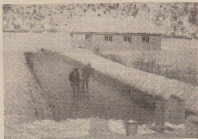
Jedan od ribnjaka ribogojilišta Vitunj

Jedino je uz najveće poteškoće pribavljena manja količina matice za Vitunj i nešto više za Gacku. Vitunj je postigao samo 40.000 komada ikre, a Gacka 180.000 kom. ikre. Ribogojilište Zagrebačkog ribarskog društva u Samoboru nije također moglo pribaviti nijedne matice pa je kupilo ikru iz Ribogojilišta Dragomelj kod Ljubljane.