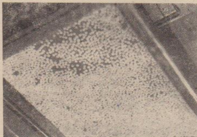
Pastrvska ikra u ležnici (inkubatoru)

Već pred tridesetak godina bilo je pritužaba da u Sloveniji propada ribarstvo, a naročito u našim pastrvskim vodama. Danas su takve pritužbe još opravdanije. Ne samo kod nas, nego i u svima državama, gdje se po-