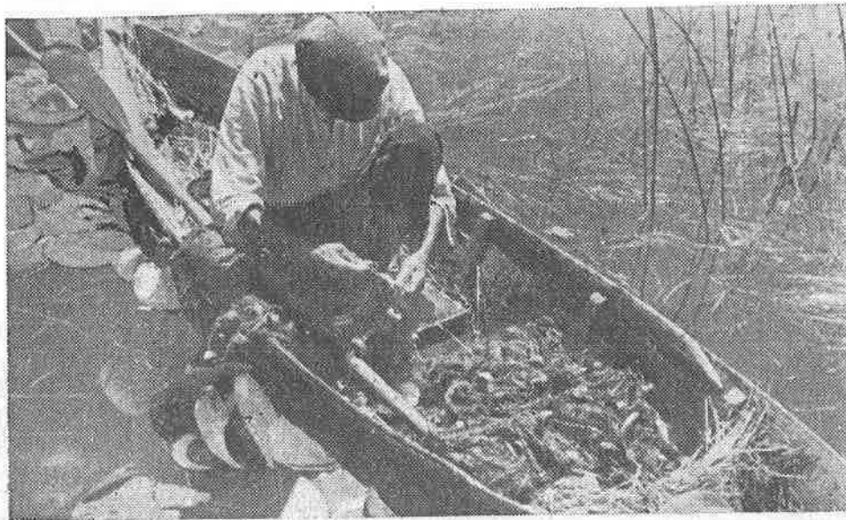
Ribar prebire lovinu

Način pregrađivanja rijeke koji je primijenjen na Neretvi, predstavlja jednu kombinaciju između domaće metode rada i rada sa modernim mrežama u zapadnoj Evropi.