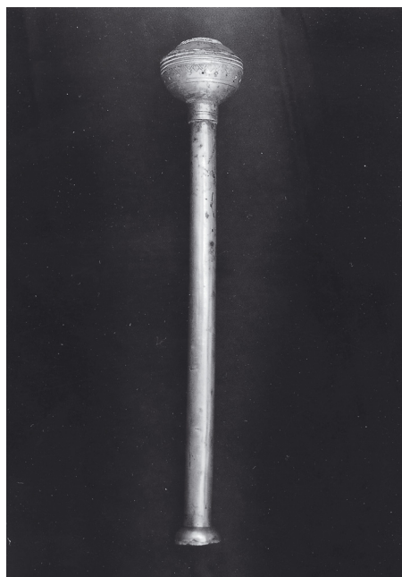
Slika 7. Zborna crkva sv. Vlaha u Dubrovniku, Dubrovački majstor, Škropilo, 19. st.?