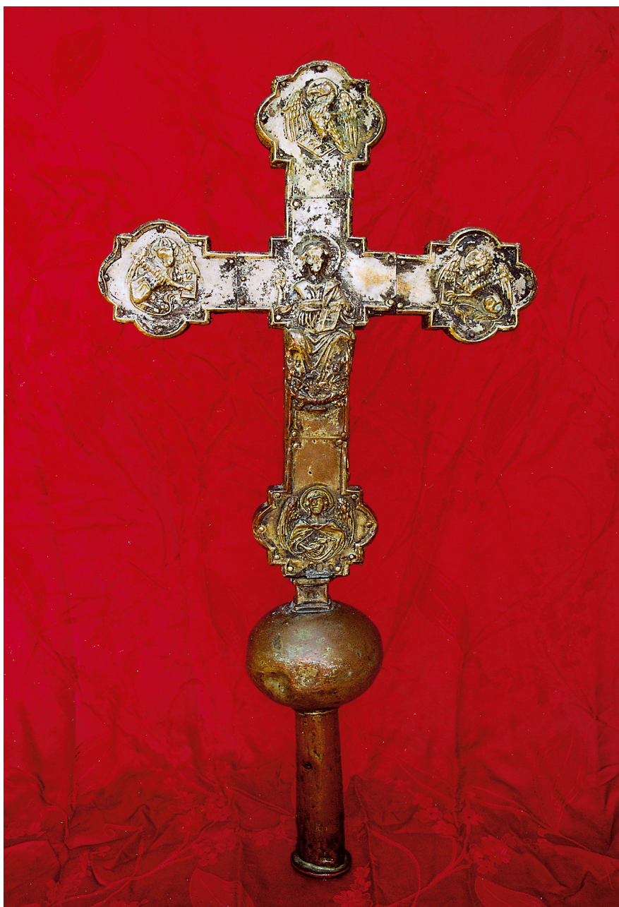
Slika 2. Župna crkva sv. Andrija na Pilama, Dubrovački majstor, Ophodno gotičko raspelo iz 14. st. (stražnja strana)