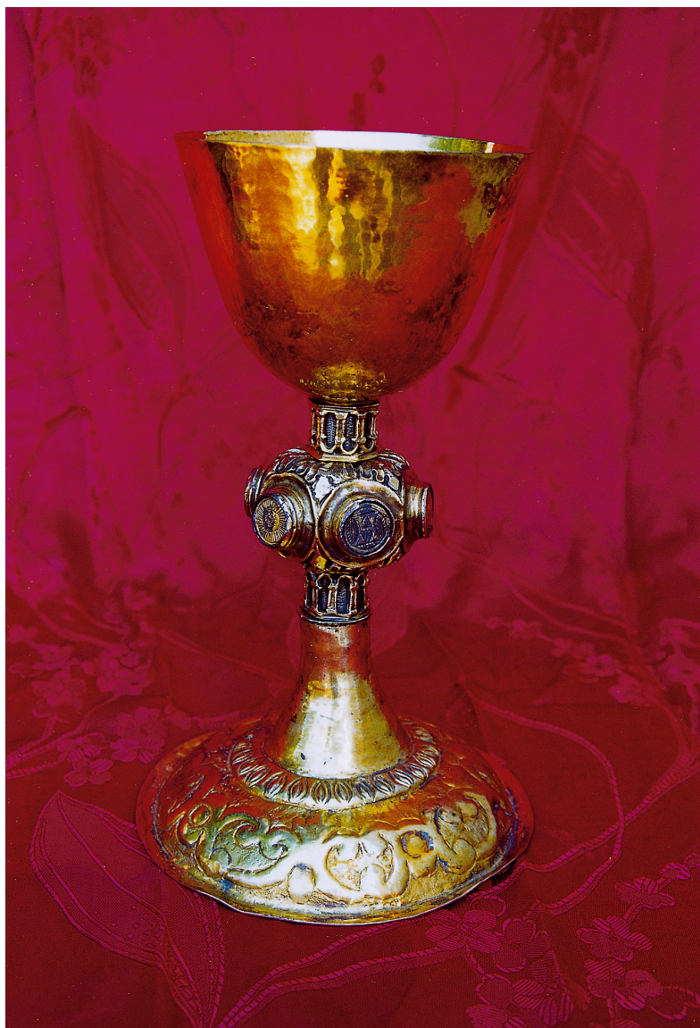
Slika 3. Župna crkva sv. Andrije na Pilama, Dubrovački majstor, Gotički kalež iz prve polovice 15. st. s popravkom nodusa iz 18. st.