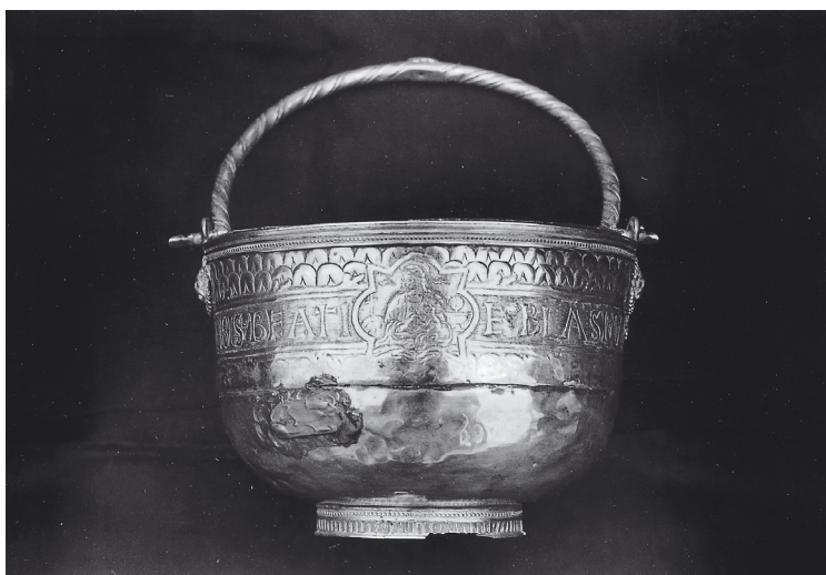
Slika 6. Zborna crkva sv. Vlaha u Dubrovniku, Dubrovački majstor, Renesansna posuda za blagoslovljenu vodu iz 16. st.