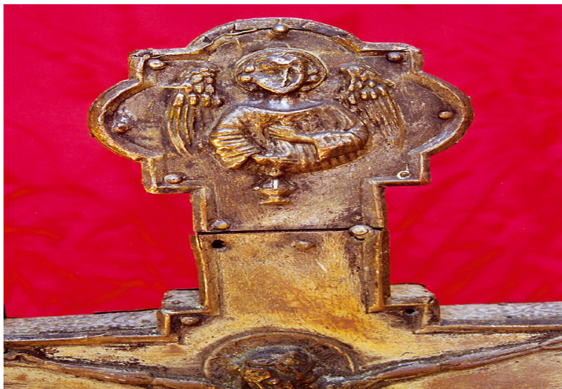
Slika 5. Detalj baze kaleža nadbiskupa Fabiusa Tempestivusa

Ovim radom nastojalo se potaknuti detaljno istraživanje crkvenih sakristija u tragu za starijim liturgijskim predmetima koji su izmakli oku ranijih istraživača, a osobito su bitni za stvaranje slike likovnih strujanja u Dubrovniku od 14. do 17. stoljeća, svjedočeći o golemom civilizacijskom značenju Dubrovnika kao kulturne spojnice Istoka i Zapada.