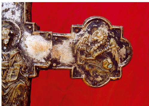
Slike 2.1. do 2.5. Detalji stražnje strane