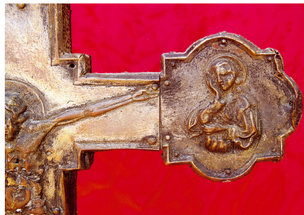
Slike 1.1. do 1.5. Detalji prednje strane