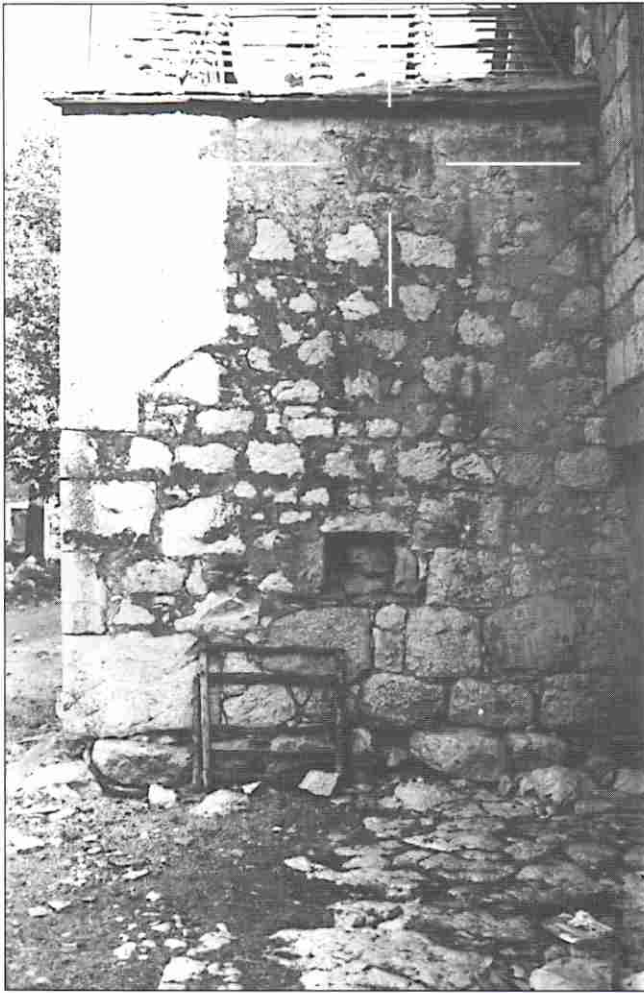
Slika 1. Kuća Petra Mešine, u zaseoku Mešini (selo Umljanovići), na čijem je dokrovnom bočnom zidu, kao spolija, uzidana mitraička kultna slika - reljef tauroktonije