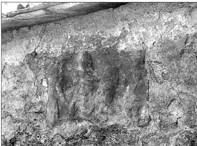
Slika 2. Mitraička kultna slika - reljef tauroktonije, iz Umljanoviča