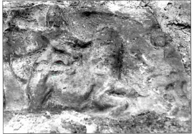
Slika 3. Detalj mitraičke kultne slike