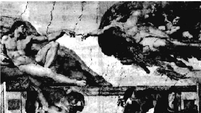
Michelangelo: Stvaranje čovjeka — Sikstinska kapela

Temeljnu tvrdnju teološke antropologije, da je čovjek slika Božja i da je tijekom svoga postojanja u neprestanom odnosu prema svome Stvoritelju, osim dogmatskim i svetopisamskim postavkama, moguće je izreći i poetskom riječi. Rimski triptih odraz je takve sinteze, a potpisao ga je Ivan Pavao II., filozof, teolog i zaljubljenik u riječ koja za njega postaje otajstvo . U njegovu se pjesništvu otkriva ljubav prema riječi usađena u rodnoj Poljskoj za vrijeme mladosti i studija na Jagelonskom sveučilištu, potom se obogaćuje filozofskim i teološkim spoznajama, a svoju puninu nalazi u susretu stvorenoga i Stvoritelja.