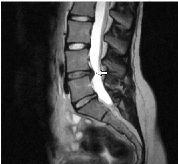
Slika 2. Magnetska rezonanca lumbosakralne kralježnice u T2 vremenu prikazuje promijenjen signal intervertebralnog diska L4-L5, uz dorzomedijalni prolaps diska

U navedenom segmentu prikazuje se fokalna dorzomedijalna ekstruzija intervertebralnog diska do 6 mm izvan koštanih okvira i kompresija neuralnih struktura. Ne nalaze se akutne traumatske promjene, niti ekspanzijske tvorbe. Elektroneuromiografija pokazuje da se radi o kroničnoj neurogenoj leziji.