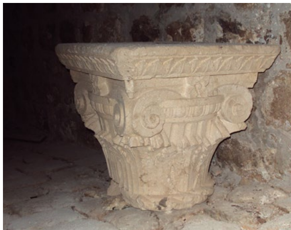
7. Kapitel all'antica u tvrđavi Bokar uklonjen s Divone u historici- stičkoj intervenciji, Arheološki muzej Dubrovnik (snimio F. Čorić) An all'antica capital in the Bokar Fortress, removed from the Divona in the historicist intervention, Dubrovnik Museums – Archaeological Museum (photo by F. Čorić)

An all'antica capital in the Bokar Fortress, removed from the Divona in the historicist intervention, Dubrovnik Museums – Archaeological Museum, Inv. No. 1976 (photo by F. Čorić)