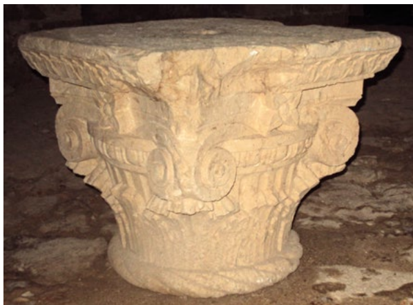
6. Kapitel all'antica u tvrđavi Bokar uklonjen s Divone u historici- stičkoj intervenciji, Arheološki muzej Dubrovnik, inv. ozn. 1976

An all'antica capital in the Bokar Fortress, removed from the Divona in the historicist intervention, Dubrovnik Museums – Archaeological Museum, Inv. No. 1976