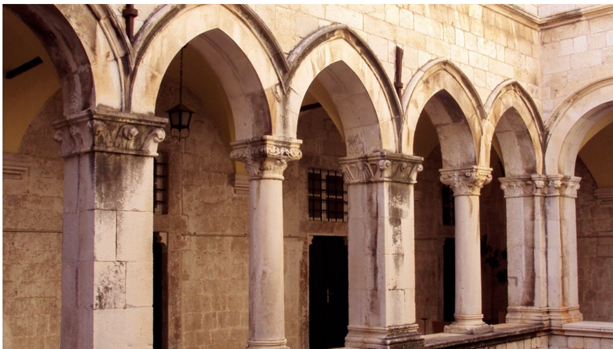
4. Danas vidljivi tragovi staklenih zatvora u jugozapadnom dijelu dvorišta The nowadays visible traces of glass covers in the south-western portion of the courtyard

baštine, ubrzo je nakon Drugog svjetskog rata doživjela niz konzervatorsko-restauratorskih intervencija. 22