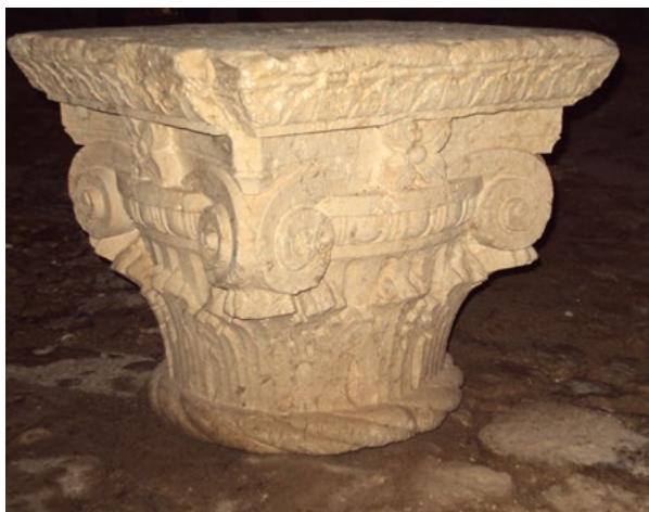
8. Kapitel all'antica u tvrđavi Bokar uklonjen s Divone u historici- stičkoj intervenciji, Arheološki muzej Dubrovnik An all'antica capital in the Bokar Fortress, removed from the Divona in the historicist intervention, Dubrovnik Museums – Archaeological Museum