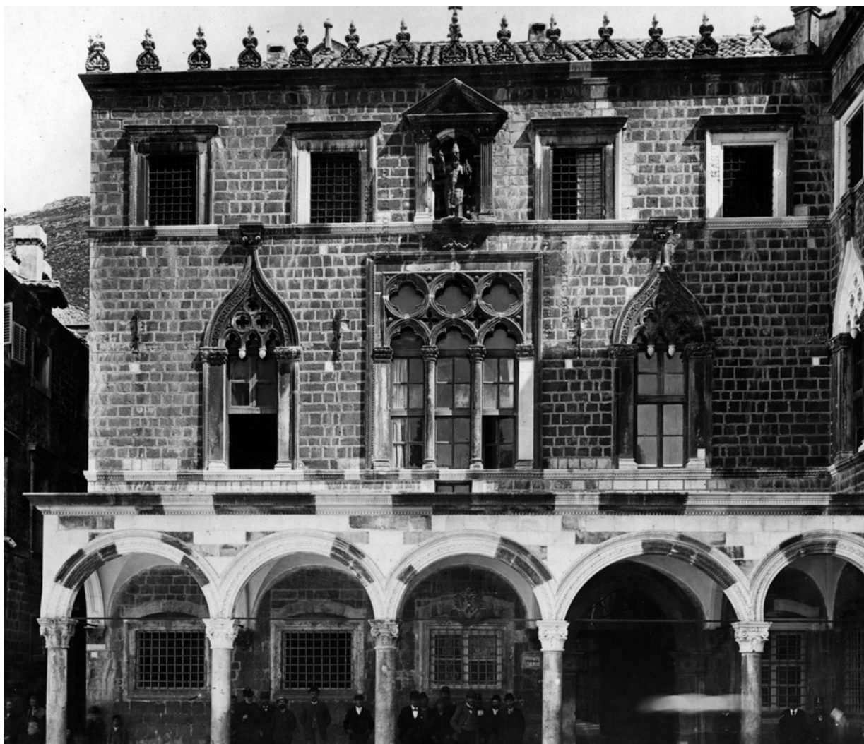
2. Glavno pročelje Divone nakon historicističkog zahvata s jasno razlučivim novim dijelovima (knjižnica ALU-a Zagreb, Album Josefa Wlha, inv. br. 2067, skenirao M. Grbić)

The main façade of the Divona after the historicist intervention, with the new portions clearly discernable (Library of the Academy of Fine Arts, Zagreb, Josef Wlha's album, Inv. No. 2067, scanned by M. Grbić)