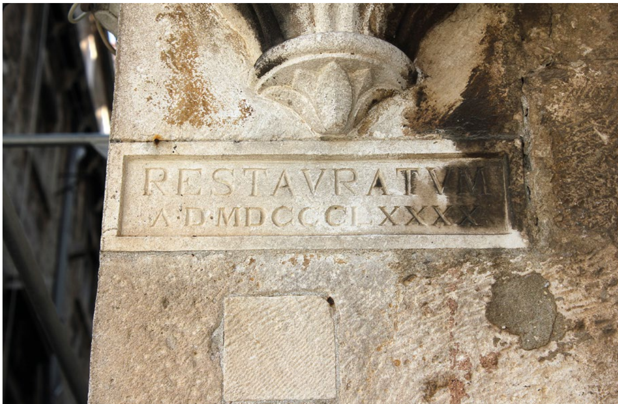
5. Ploča s natpisom o restauriranju 1890. ispod najzapadnije konzole trijema Panel with an inscription about the 1890 restoration, underneath the westernmost console of the loggia

istovremeno s pročeljem. Prema toj publikaciji, prizemlje i prvi kat su ranijeg nastanka, a drugi kat i dekoracije nastali su poslije. Dok je prvi kat nekoć služio okupljanju plemstva u kulturne i znanstvene svrhe, na drugome je bila kovačnica novca, a u prizemlju skladišta carinarnice. Hänisch je u svoje vrijeme u prizemlju i na prvom katu zatekao financijsku upravu i carinarnicu, gdje su se uglavnom skladištili sol, duhan i konac, dok su drugi kat i potkrovlje bili u općinskom vlasništvu i u podnajmu poslovnim ljudima koji su ondje skladištili vunu, kožu, kukuruz i zob. Napomenuo je da se na opekome popločenom platou nad trijemom do prije koju godinu u vrijeme karnevala održavalo javno izvlačenje tombole pa je zbog te namjene bila podignuta teška željezna ograda s nosačima za navlačenje platna.