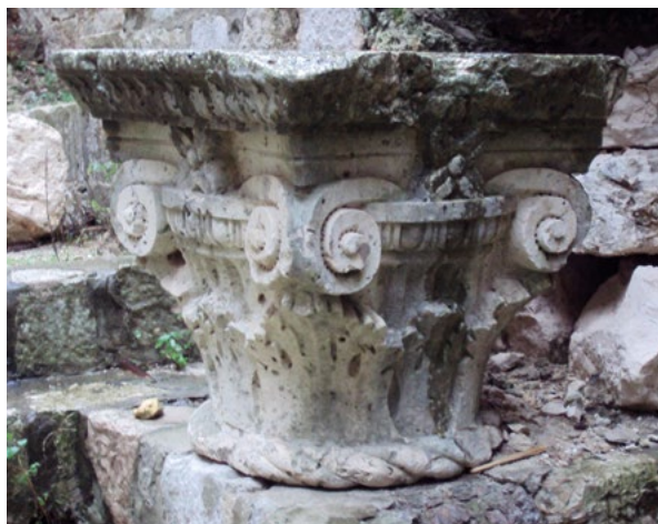
9. Četvrti kapitel s Divone u tvrđavi Bokar (?), Arheološki muzej Dubrovnik The fourth capital from the Divona in the Bokar Fortress (?), Dubrov- nik Museums – Archaeological Museum

dijelove pohraniti na sigurno mjesto. U drugoj etapi ih je trebalo ponovno sastaviti uz korištenje starog materijala i nadomještanje neupotrebljivih dijelova precizno i „stilu primjereno izvedenim“ novim dijelovima. Treća etapa bila je restauriranje pročelja, a četvrta restauriranje dvorišne arkade i oplata zidova s vijencima. Završno je naveo da su potrebni manji popravci i adaptacije u prostorijama kojima se koristi financijska uprava te da su u tijeku pregovori s općinom o vlasništvu nad objektom, budući da je jedan dio zgrade bio u općinskom vlasništvu.