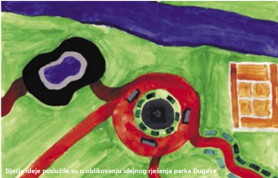
Dječje ideje poslužile su u oblikovanju idejnog rješenja parka Dugave