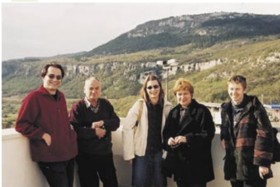
Prvi tim edukatora u projektu Zdrava županija