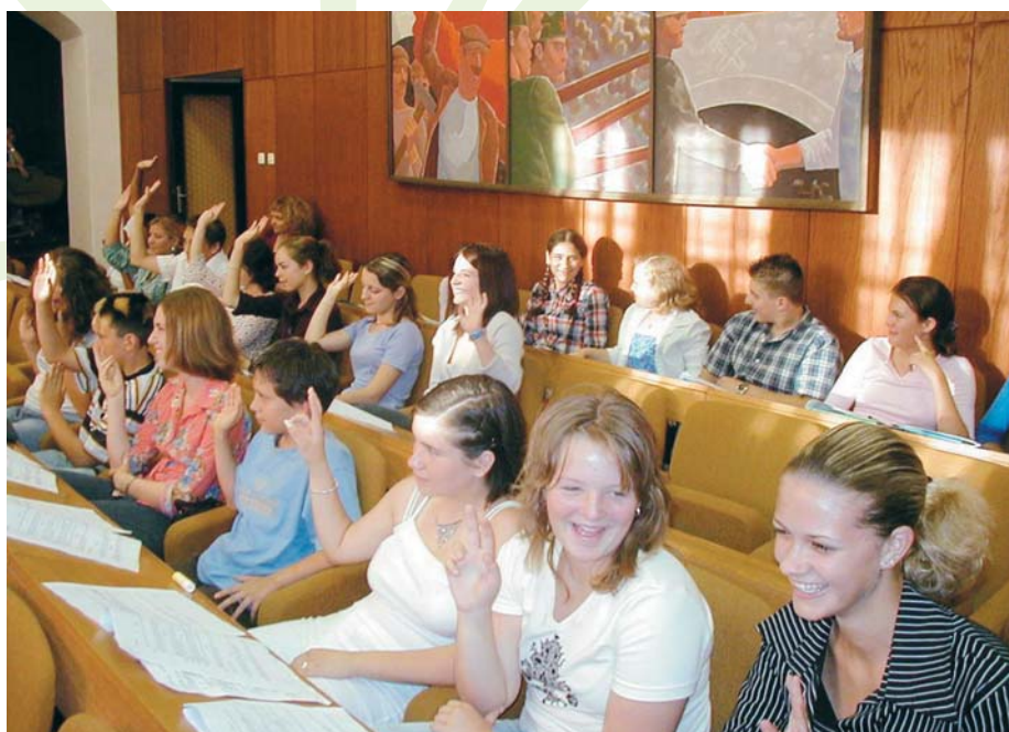
Svi smo »za«!

Debata kao umijeće i vještina uči kulturu dijaloga u javnoj komunikaciji oslanjajući se na snagu argumenata, a ne na argument snage, što svakako predstavlja poželjan demokratski standard. Ona pospješuje i razvija i kulturu slušanja, uvažavanja »protivničkog« govornika i nenasilnog suprotstavljanja drukčijem mišljenju, pa pridonosi i demokratskom ponašanju.