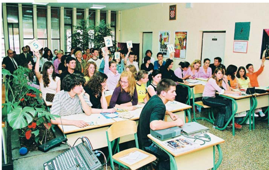
Županijsko Vijeće mladih

– Ranije nismo bili povezani, no od kada surađujemo na ovom programu, profesorima se možemo obratiti zbog bilo kakvog problema. Također, i atmosfera među učenicima je prijateljska. Među nama nema sukoba, ni natjecanja. Na sjednicama nam nije cilj pokupiti novac za realizaciju svog projekta, nego glasamo prema savjesti, odnosno