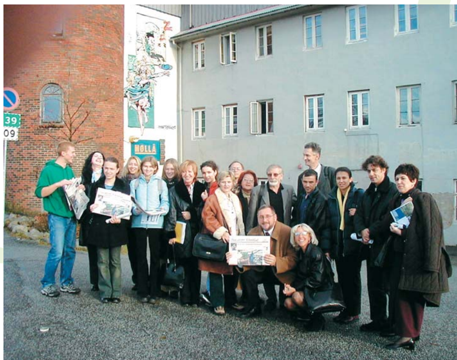
Hrvatska delegacija s Geirom Hetlandom

ju su sačinjavala još po tri predstavnika iz Slavonskog Broda i Metkovića. Navedene su sredine aktivno uključene u mrežu Zdravih gradova i programski sudjeluju u radu međunarodne Škole demokracije koja se odvija u sklopu Ljetne motovunske škole za promicanje zdravlja sa sjedištem u Srednjoj školi Mate Blažine. Norveška je uključena u europsku mrežu Zdravih gradova, a grad Sandnes održava i razvija posebne oblike suradnje s Hrvatskom na promicanju demokratskih projekata, sudjeluje u radu Škole demokracije, čiji je i međunarodni koordina-