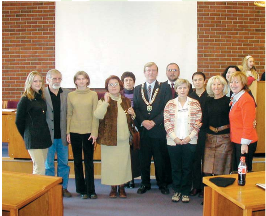
Hrvatska delegacija s gradonačelnikom Sandnesa

čin da se mladež izjasni, odnosno da izloži svoje interese i prijedloge koji bivaju uzeti u obzir od strane gradonačelnika, odnosno Gradske uprave.