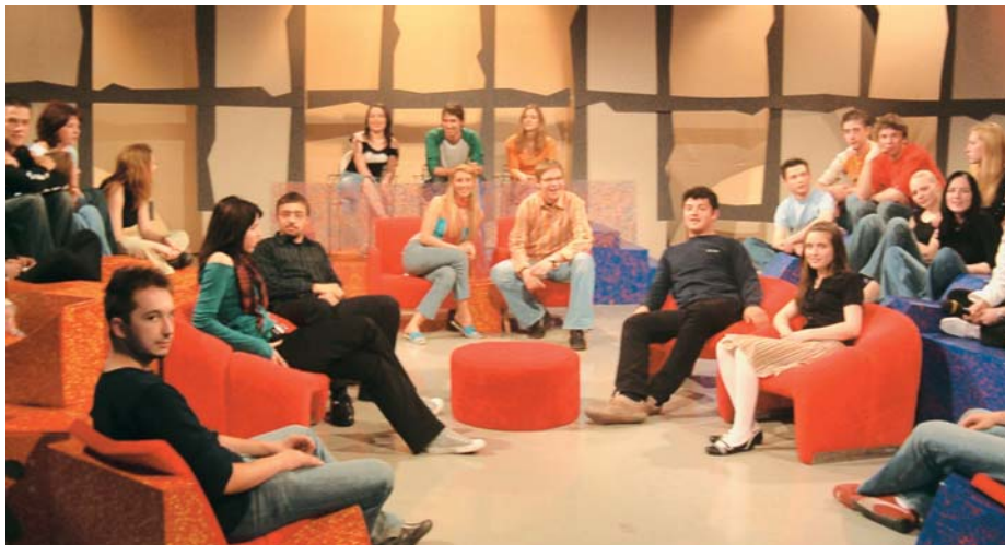
Parlaonica na HTV-u