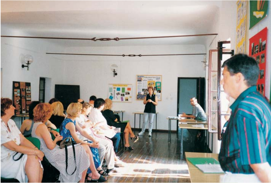
Uvodno izlaganje nacionalne koordinatorice HMZG

Školi prihod koji se preraspoređuje kako bi se pomoglo održavanje tečajeva (mahom okrenutih kvaliteti života djece i mladih, starih, obitelji, nezaposlenima, održivom razvoju i sl.) koji se bez »financijske injekcije« ne bi mogli održati. Na taj smo element »socijalnosti« posebno osjetljivi (oni koji plaćaju kotizaciju moraju znati zašto to rade) i ponosni (zato što smo odoljeli izazovima tržišne ekonomije i očuvali socijalnost kroz sve godine rada).