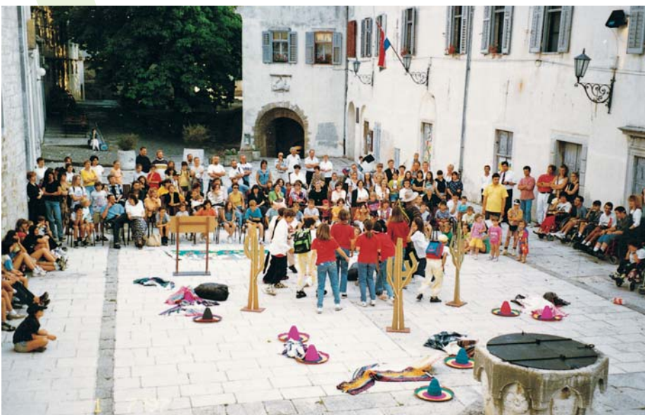
Radionica mladih na središnjem trgu u Motovunu

cijeni stresa na radnom mjestu, o uključivanju zajednice u oblikovanje zdravstvene politike, o odgovornom informiranju javnosti, o zdravlju žena i mnogim drugim temama koje su zahtijevale pažnju kako struke tako i politike.