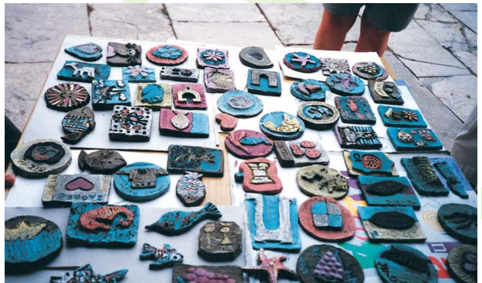
Plodovi likovne radionice

Svake se godine kroz Motovunsku školu »otvara« po jedna »nova« tema, adresirajući posebno značajan javnozdravstveni izazov (mi se ne služimo riječju problem – obeshrabruje akciju, opaska autora). Tako se kroz Motovunske tečajeve u Hrvatskoj progovorilo o održivom razvoju i socijalnoj odgovornosti poduzetništva, o mobingu i