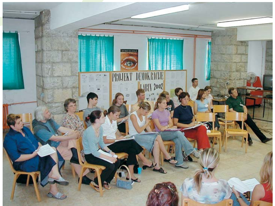
Tečaj Škole demokracije – Vijeća mladih u Labinu 2002. godine

nastave i cijela je škola u funkciji Mini-parlamenta (s obzirom na to da je i znatan dio učenika i nastavnika neposredno ili posredno uključen u tu aktivnost). Za nastavnike i učenike koji nisu angažirani u projektu unaprijed se planira neka stručna ekskurzija ili