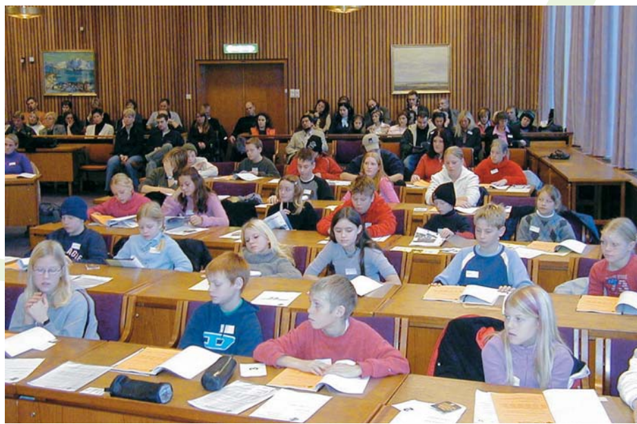
Vijeće mladih grada Sandnesa, Norveška

ćio da se, na funkcionalniji način, motiviraju i uključe učenici u stjecanje znanja i vještina o politici i političkom angažmanu. Jer ovaj program potiče: cjeloživotno učenje,