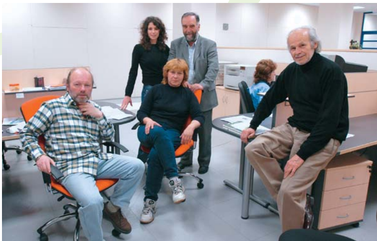
Kreativna ekipa Epohe Zdravlja

Zašto je to važno? Mora li svaki građanin biti »osviješten« politički? Ne... ali usvojenje jedne određene razine znanja u kritičnom broju građana, poželjno je, ako ne i nužno za boljitak jedne sredine. Stoga treba teži-