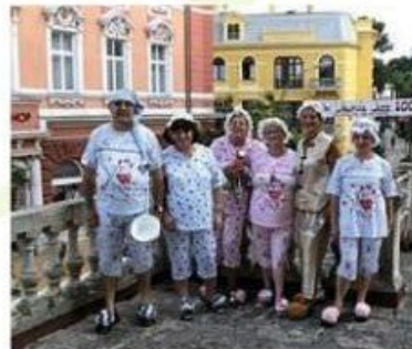
I starost može biti lijepa, opatijski Klub 60+, pripreme za Ljetni senjski karneval, na terasi Kluba