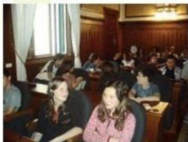
Dječje Gradsko vijeće