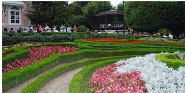
Opatijski park – uredene zelene površine zaštitni su znak Opatije