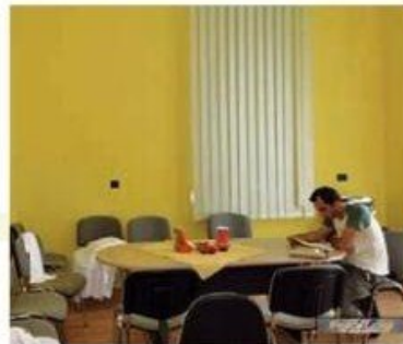
Prostor Udruge osoba s invaliditetom Grada Opatije