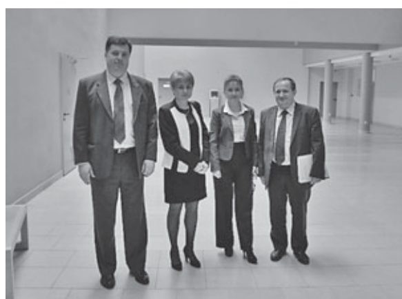
Slika 5. Uspomena na Dan kvalitete Šumarskog fakulteta

gramskih ugovora s Ministarstvom znanosti, obrazovanja i sporta te aktivnosti i sredstva projekta IPA BGUE 0406, kao potpore razvoju sustava kvalitete. Na kraju predavanja prof. Jambrečković naveo je koji su nužni zahvati u sustavu kvalitete te prikazao novi pristup u razvoju sustava kvalitete koji osigurava visoku razinu kvalitete te mjesto među vodećima na Sveučilištu i u regionalnom okruženju.