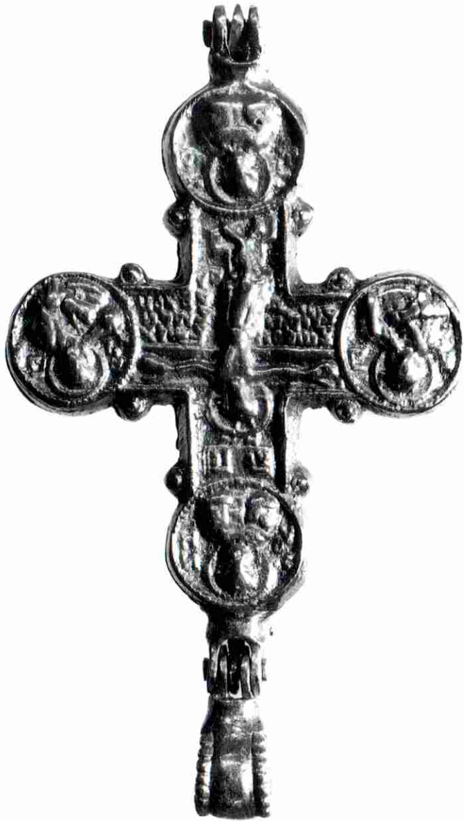
Abb. 2.a, 2.b Enkolpion des "Kiev"-Typus, Inv.-Nr. des Kroatischen Geschichtlichen Museums 1529