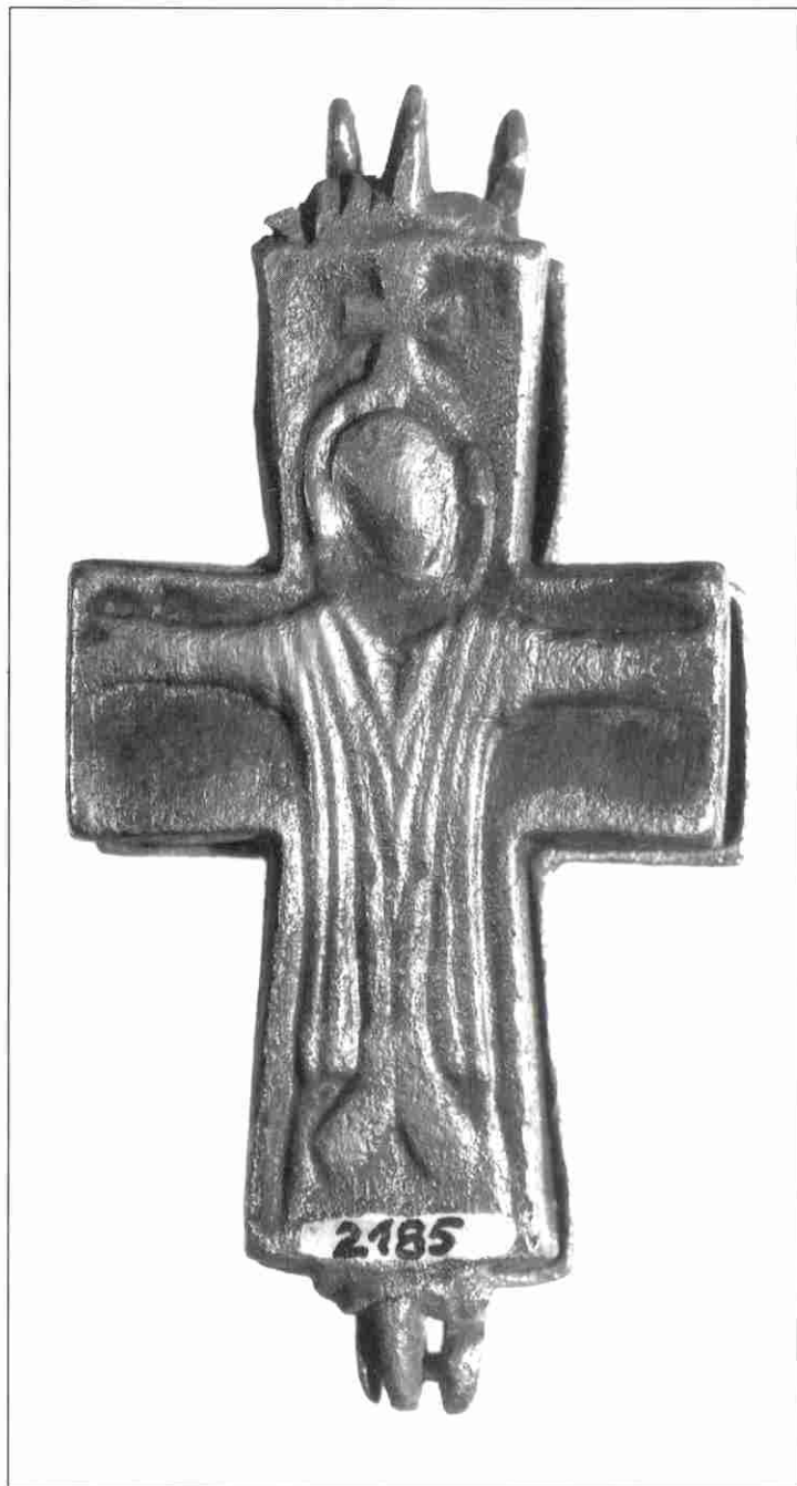
Slika 1. a. 1. b Enkolpion tip "Sveta zemlja" HPM-inv. br. 2185

Abb. 1.a, 1.b Enkolpion des Typus "Heiliges Land". Inv.-Nr. des Kroatischen Geschichtlichen Museums 2185