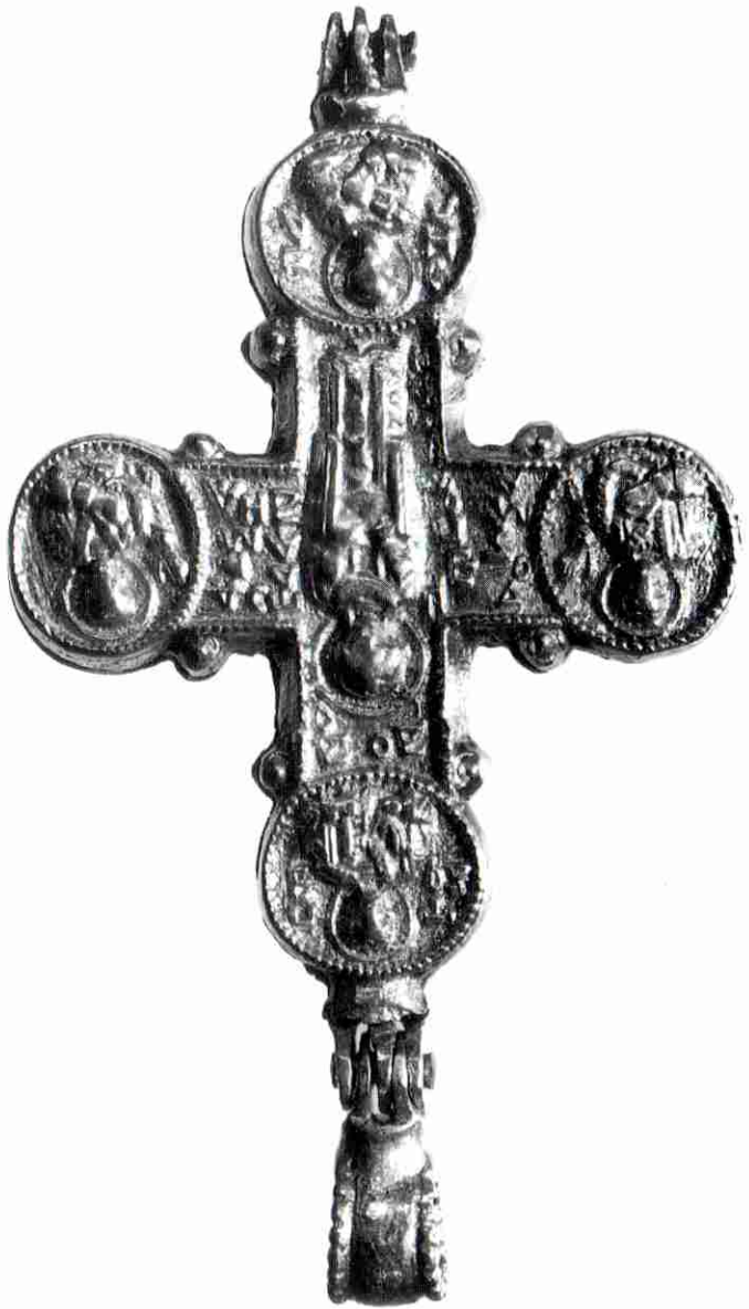
Slika 2. a, 2. b "Kijeovski enkolpion" HPM-inv. br. 1529

Abb. 2.a, 2.b Enkolpion des "Kiev"-Typus, Inv.-Nr. des Kroatischen Geschichtlichen Museums 1529