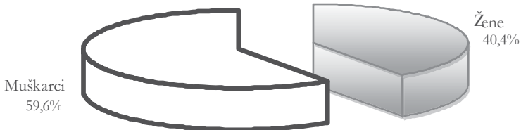
Grafikon 3: Struktura zaposlenih u sivoj ekonomiji po spolu