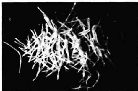
Klasično ribanje sira (desno) i ribanje na mašini CC Slicer tvrtke »URSCHEL«