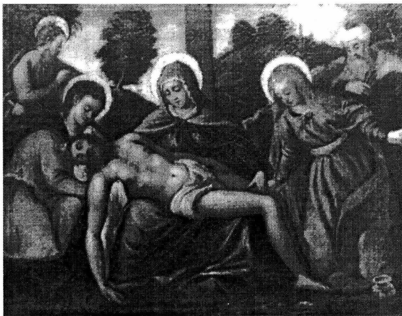
"Pietà" iz kapele na groblju u Hvaru

Zaključujemo (prvenstveno po amaterskoj intervenciji u dnu slike) da se kraćenje dogodilo svakako nakon 1883. godine, početkom 20. vijeka, a prije 1936-40. godine. Ovim zahvatom oštećena je ova kvalitetna umjetnina, koja je jedna od starijih slika hvarskog likovnog fonda. 10