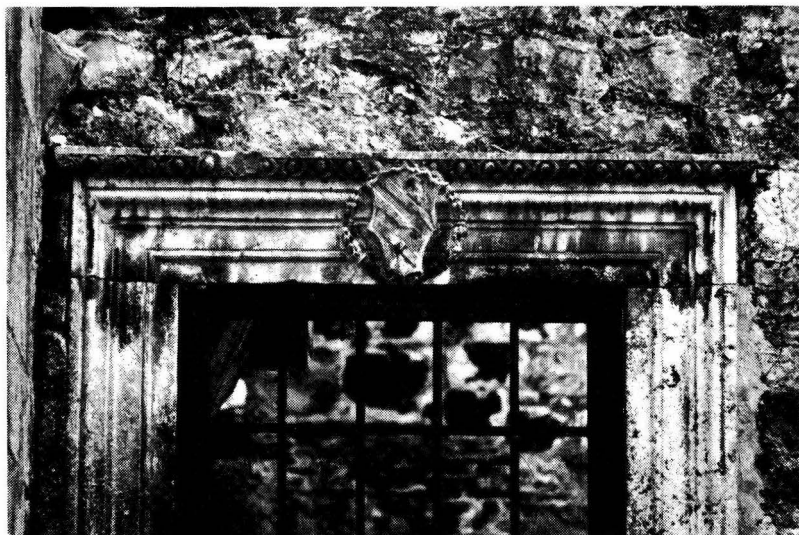
Hvar - kuća tzv. Hektorović: glavni ulaz s grbom (snimio Ivo Vučetić)

Na kući su tri jednaka grba: dva su na vrhovima doprozornika, jednog od prozora na prvome katu s istoka, uz prometnu ulicu s koje su imali biti vidljivi prolaznicima, a treći je na glavnom ulazu sa zapada, u lisnom vijencu posred nadvratnika. Jednaku zamisao dvostruka grba na monofori nalazimo i na kući Nikole Barbića, na pjaceti ispred crkve Sv. Duha u Gradu, sagrađenoj 1468. 11 , odakle se moglo pretpostaviti da je i pregradnja kuće o kojoj se govori mogla početi oko te godine. Iako su u pitanju različiti klesari (onaj kuće Barbić je u pojedinostima mnogo kvalitetniji), obje su monofore zamišljene od vrsna, moguće istoga projektanta.