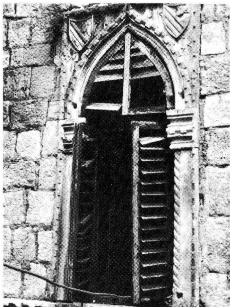
Hvar - kuća tzv. Hektorović: prozor s dvostrukim grbom

Istaknuto pročelje sa skladnim, asimetrično postavljenim cvjetnogotičkim otvorima i samo je, sudeći po kamenu, zidano u dva maha i najgornji se (treći) kat s juga čini neznatno novijim 9 . Ni slogovna zamisao nije u pojedinostima jedinstvena: ulazna vrata sa zapada, na vrhu stubišta 10 za prvi kat, imaju čist i lijep renesansni oblik, kao što je renesansan i zidni umivaonik nadesno od istog ulaza. Ali ove manje slogovne razlike zacijelo ne ukazuju na raznovremenost gradnje, jer je preplitanje stilskih značajki bilo u nas uobičajeno i u većoj mjeri.