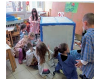
Odlučuju da je potrebno staviti dva sloja boje, da se ne vidi boja kutije.