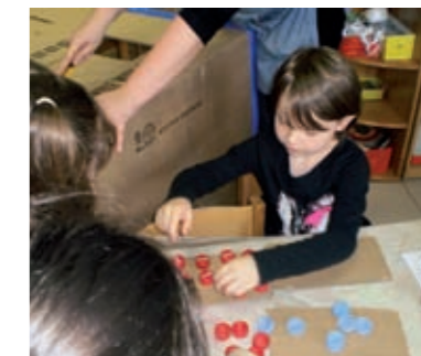
Nakon što je odgajateljica nabavila veliku kutiju i izrezala otvore na prijedlog djece, jedan dio djevojčica radi tastature i gumbе za vanjski dio broda.