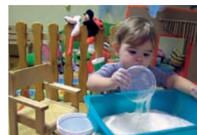
...te ga prosipa natrag u kadiču...