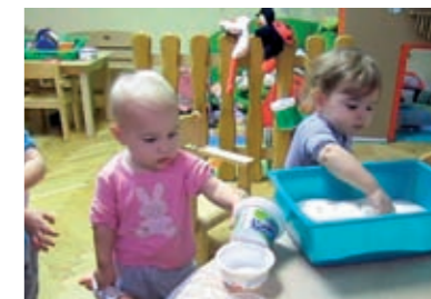
...provjerava ima li u njoj još brašna...