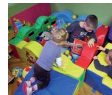
...sviraju i igraju se s njima...