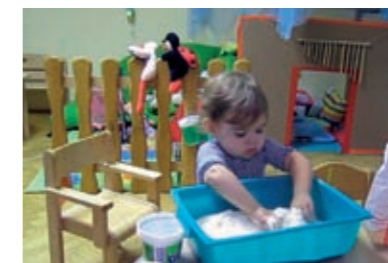
...pa objema rukama istovremeno...