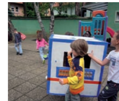
Cijeli proces izrade svemirskog broda trajao je 2 tjedna, te smo organizirali primopredaju.