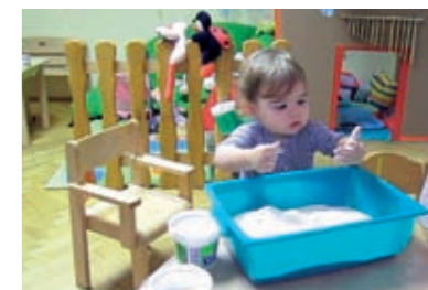
...promatra kako joj brašno prolazi između prstiju...