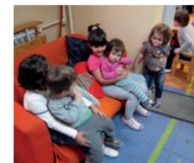
...maze ih, pričaju im priče i tepaju.