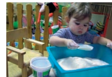
...grabi brašno pomoću poklopca...