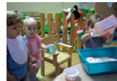
...pokraj kadiče pronalazi papirnatu vrećicu od brašna...