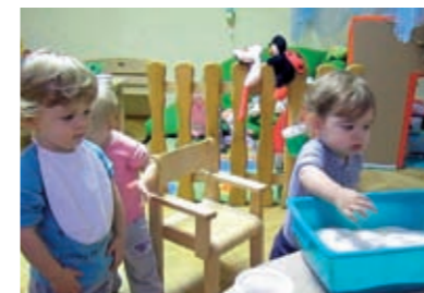
...dijete prilazi kadiči s brašnom... opipava ga...