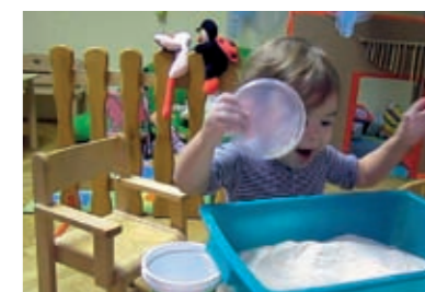
...te iskazuje oduševljenje.