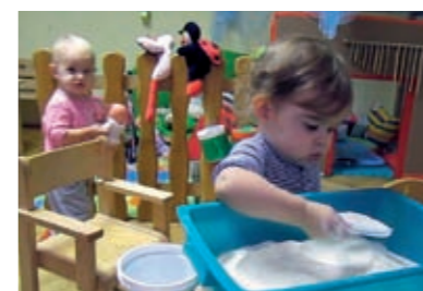
...nekoliko puta ponavlja istu stvar...