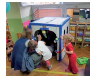
Djeca rane dobi isprobavaju svemirski brod i sve što se u njemu nalazi, dok neki promatraju što odgajateljica snima.