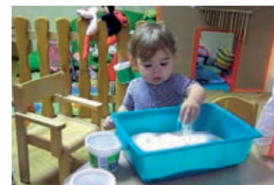
...dijete dirá brašno naizmjenice desnom pa lijevom rukom...