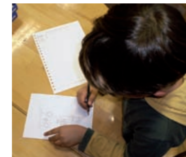
Danijel (6,4 g.), koji nikad nije bio u posjetu jaslicama, i nije prije pokazivao interes za posjete, crta svoj prijedlog što izraditi za djecu rane dobi.