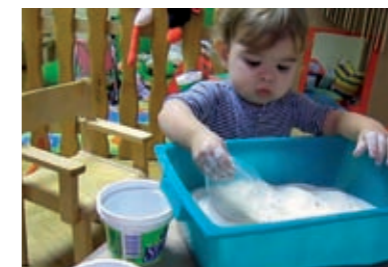
...uzima plastični poklopac...