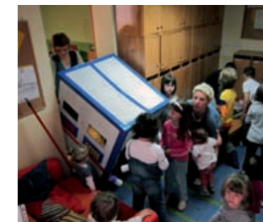
Dogodilo se da svemirski brod ne može ući kroz vrata sobe jer je preširok, pa smo ga unijeli kroz prozor.