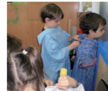
Zajedno s mlađom djecom rade pripreme za bojanje (pomažu mlađima).