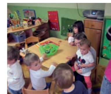
Djeca predškolske dobi tijekom zadnjeg posjeta jaslicama na različite načine ulaze u interakcije s djecom rane dobi, pjevaju im...