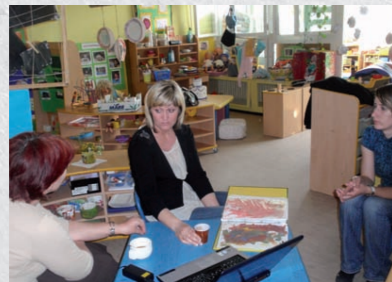
Većina odgajatelja ima iskustvo u savjetovanju roditelja

Jedan od oblika suradnje odgajatelja i roditelja ostvaruje se savjetovanjem koje je propisano člankom 29. Državnog pedagoškog standarda predškolskog odgoja i naobrazbe te glasi: 'Uz obvezu neposrednog odgojno-obrazovnog rada s djetetom i skupinom djece, ostali poslovi odgajatelja obuhvaćaju, između ostaloga, i suradnju i savjetodavni rad odgajatelja s roditeljima.' Cilj savjetodavnog rada je ojačati kompetencije roditelja i načine suočavanja s problemima u odgoju. Prilikom savjetovanja, odgajatelj prenosi roditelju svoja stručna znanja vezana uz odnos prema djetetu s kojim svakodnevno provodi vrijeme bilo u igri, radionicama ili drugim aktivnostima organiziranim u vrtićkim grupama. Roditelj kroz savjetovanje afirmira i vlastite snage i ohrabren je mobilizirati vlastite sposobnosti. Savjetovanjem odgajatelji od roditelja dobivaju i pomoć u vidu prikupljanja ideja ili u samoj realizaciji projekata