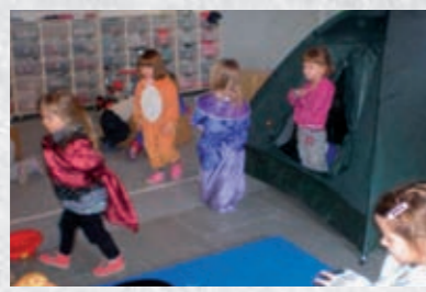
Postupno uvođenje promjena