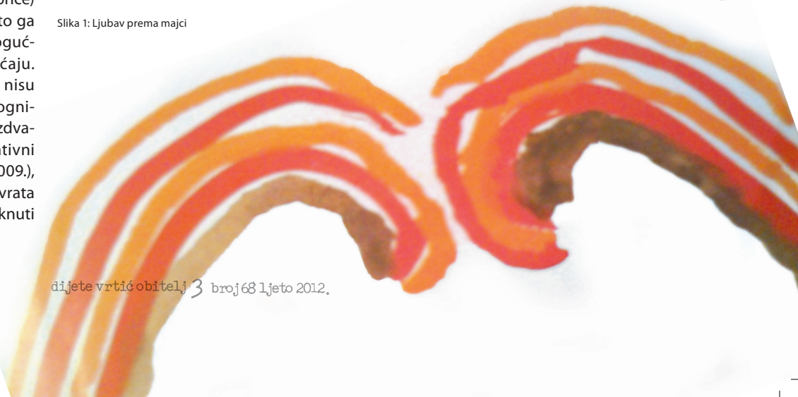
Slika 1: Ljubav prema majci

emocionalne inteligencije, odnosno posebne skupine sposobnosti kojima djeca uče izraziti i vrednovati emocije, razumjeti njihove izvore i posljedice te ih regulirati. Budući da neki autori pretpostavljaju da se emocionalna inteligencija može razviti, sve češće koriste termin emocionalnog učenja kojim