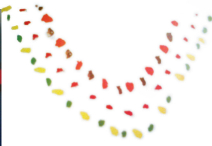
Slika 3: Suptilnost osjećaja