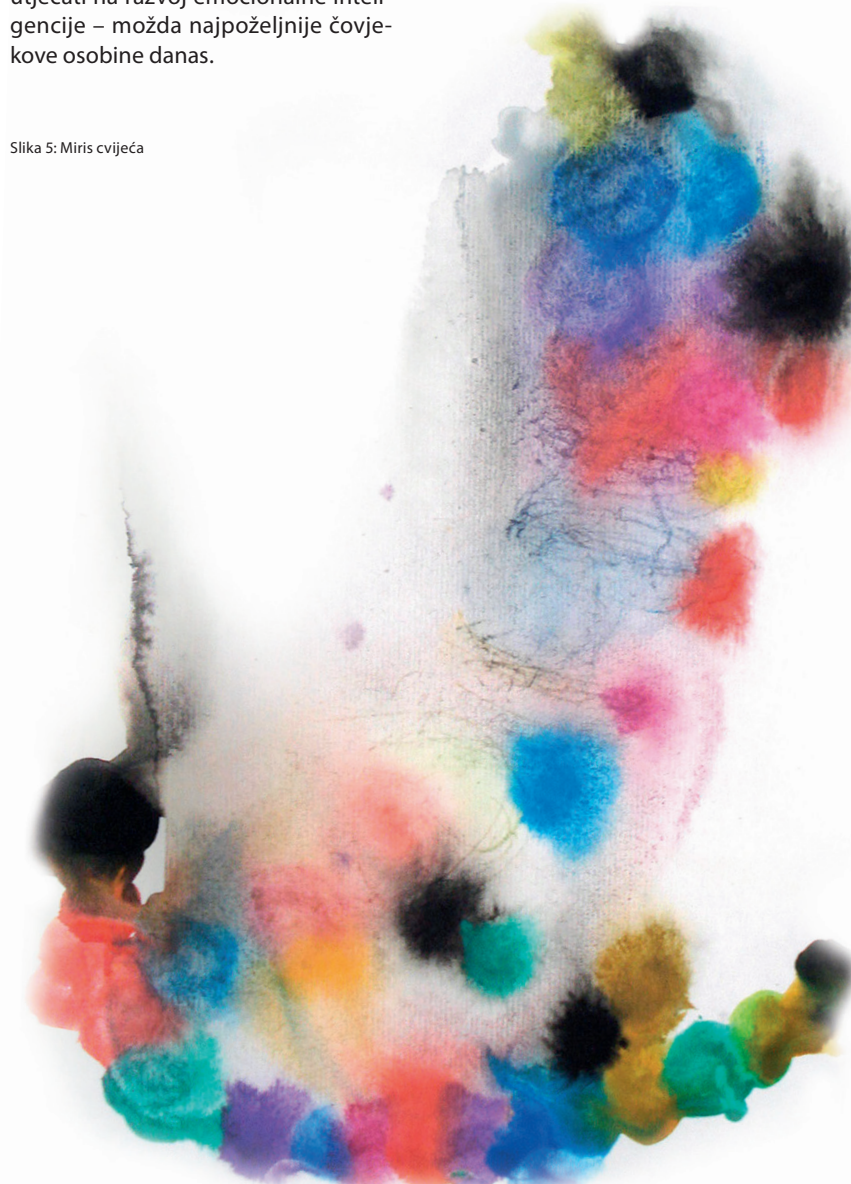
Slika 5: Miris cvijeća

potrebe. Suprotno tome, djeca koja ne prepoznaju ili pogrešno protumače svoje i tuđe osjećaje najčešće iznalaze neprihvatljiva rješenja problema bez obzira na svoje intelektualne sposobnosti (Salovey, Sluyter, 1999.), a osobito iskazuju agresivnost i teškoće u odnosima s vršnjacima. Budući da se emocionalne vještine, kao i većina drugih vještina, mogu naučiti i unaprijediti promišljanjem i kontinuiranim učenjem, ustanove ranog odgoja su prva mjesta za promoviranje emocionalne inteligencije i razvoja emocionalne pismenosti. Iskazivanje emocija kroz likovni (neverbalni) proces može utjecati na razvoj emocionalne inteligencije – možda najpoželjnije čovjekove osobine danas.