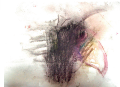
Slika 4: Oslobođanje napetosti