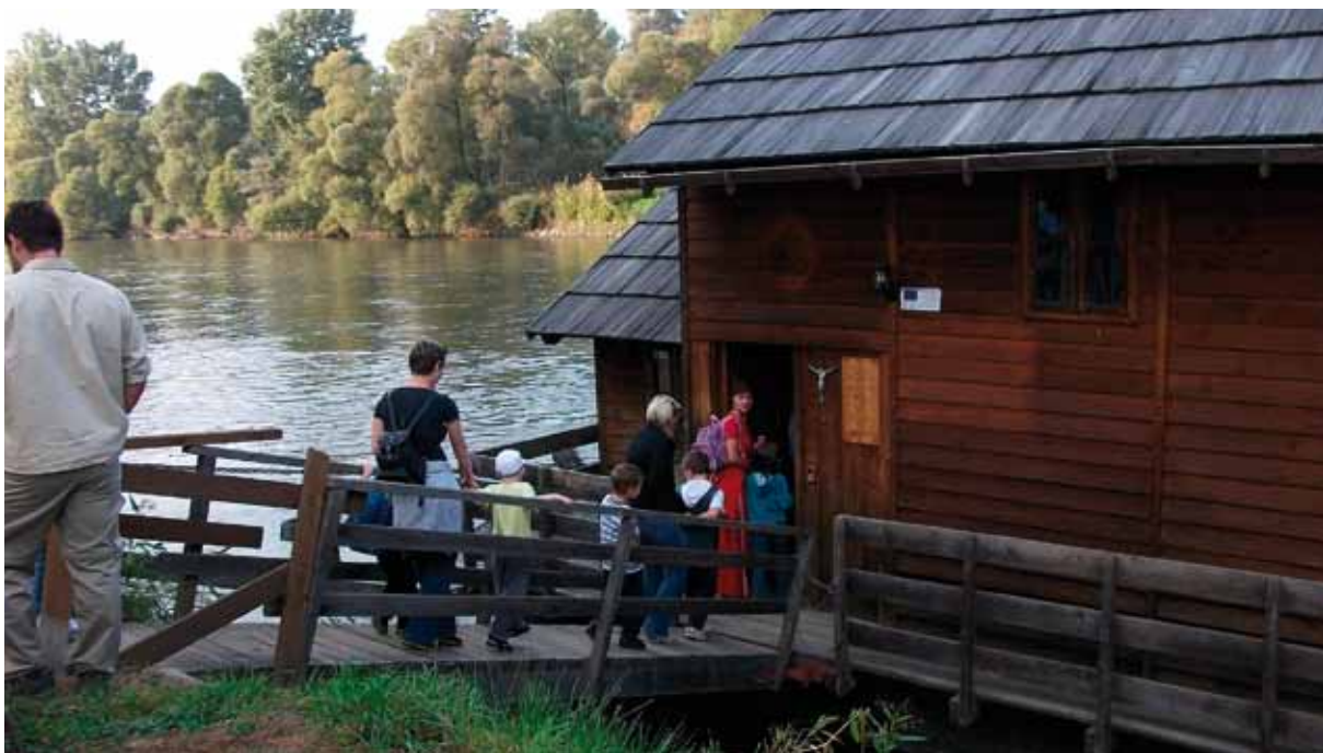
Stari mlin na Muri

drugih i svijeta. (Konvencija o pravima djeteta, 1989.)