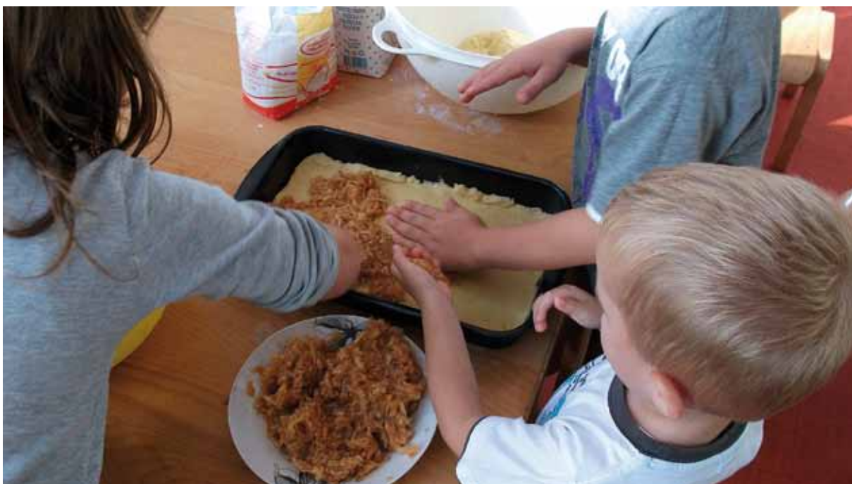
Iskustvenim učenjem djeca su imala prilike pripremati tradicionalna jela

aspekt kulture je jezik. Jezik nam između ostalog omogućuje da djeci usmenom predajom približimo i prenesimo kulturu prethodnih generacija... ili kulturu vlastite zemlje ili kulturu kao nasljeđe čovječanstva (Stojnović, Vidović 2012.). Djeca su kroz mnoge, priče, mitove, legende i usmenu predaju razmjenjivala iskustva o obilježavanju pojedinih svetkovina. U skladu s narodnim običajima i tradicijom, u suradnji s roditeljima obilježili smo jesensku svečanost, Valentinovo i fašnik. Naime, prepoznatljivost hrvatskog identiteta u kontekstu odgojno-obrazovne ustanove uglavnom je vidljiva povremeno, u vrijeme obilježavanja važnijih državnih ili crkvenih datuma. Ovim projektom nastojali smo hrvatsku kulturnu baštinu njegovati svakodnevno.