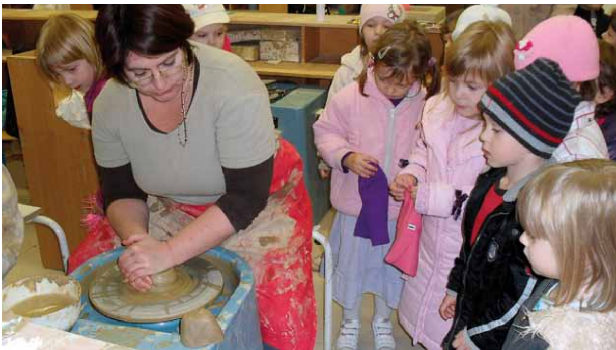
Upoznavanje sa tradicionalnim zanatima

Djeca su uz pomoć roditelja i starijih ljudi u svojoj sredini donosila u vrtić zastarjelice te im pronalazila značenje, stvarajući na taj način škrinjicu starih riječi.