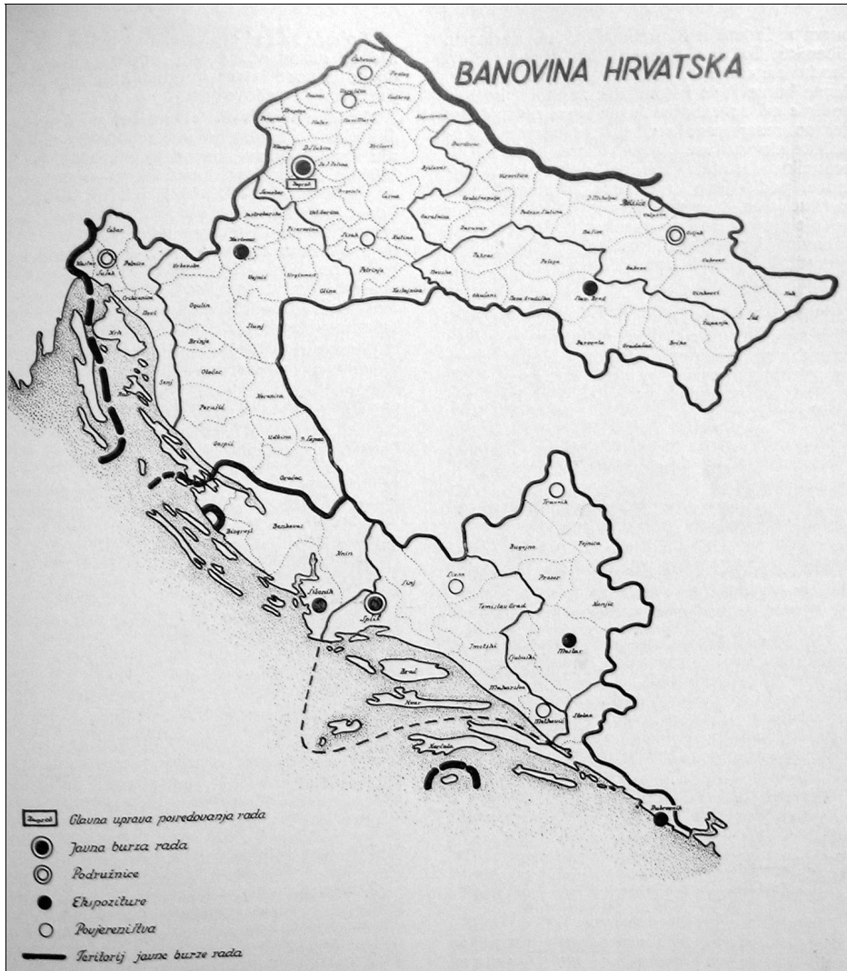
1. Karta Banovine Hrvatske s obzirom na organizacijsku podjelu Glavne uprave posredovanja rada; jasno je naznačena granica područja Ispostave banske vlasti u Splitu (u ovom slučaju se poklapa s teritorijem Javne burze rada u Splitu), Godišnjak banske vlasti Banovine Hrvatske 1939. – 26. 8. 1940. , Zagreb, 1940., str. 231.