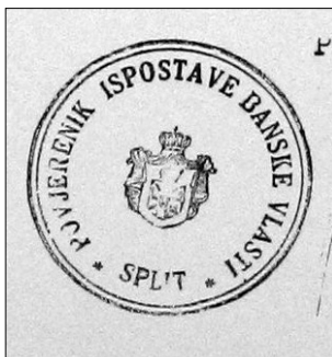
6. Pečat povjerenika Ispostave banske vlasti u Splitu.