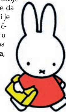
Dick Bruna: Miffy , odlikuje se pročišćenim grafičkim izrazom gotovo na razini simbola

S obzirom na tako širok spektar pristupa (koji bi se još dao proširiti) i na paralelu koju možemo povući u odnosu na stilove u povijesti umjetnosti, jasno je da ne možemo tvrditi koji je od njih bolji, preporučljiviji ili draži djeci jer u svaki je taj stil utkana još i osobnost autora,