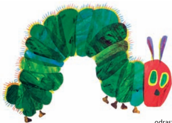
Eric Carle: Jako gladna gusjenica , izrazit je primjer slikarskog, odnosno ekspresivnog pristupa ilustriranju

ponuditi slikovnice s likovno vrijednim ilustracijama čija su obilježja: