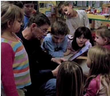
Mirnin otac djeci čita priču

slikovnice 'Miševi i mačke naglavačke' Luke Paljetka. Naše ilustracije ne sličie ilustracijama mačaka iz slikovnice! Objašnjavamo ovu nepodudarnost kontinuiranim poticanjem dječje samosvijesti, osobnosti, razvijanjem svijesti o tome da smo svi različiti i posebni, i zato koristimo vlastita rješenja i kreativnost... Bujicama smijeha pratimo čitanje, a smiju se i oni najmanji, dvogodišnjaci, koji možda ne razumiju baš sve šale velikih, ali uživaju u opuštenoj i ugodnoj atmosferi čitanja. Uključenost i uranjanje u određeni lik ili tekst intenzivira se Danom Antuntuna. To je naš poseban dan, kad djeca s roditeljima kod kuće osmisle odjeću u kojoj dođu u vrtić. Toga dana mali se mozgovi dodatno aktiviraju u nastojanju da osmisle bezazlene nepodopštine dostojne jednog Antuntuna!