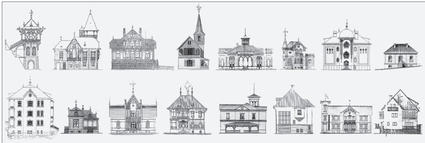
SL. 5. PROČELJA ZAGREBAČKIH LJETNIKOVACA FIG. 5. ZAGREB VILLAS, FACADES