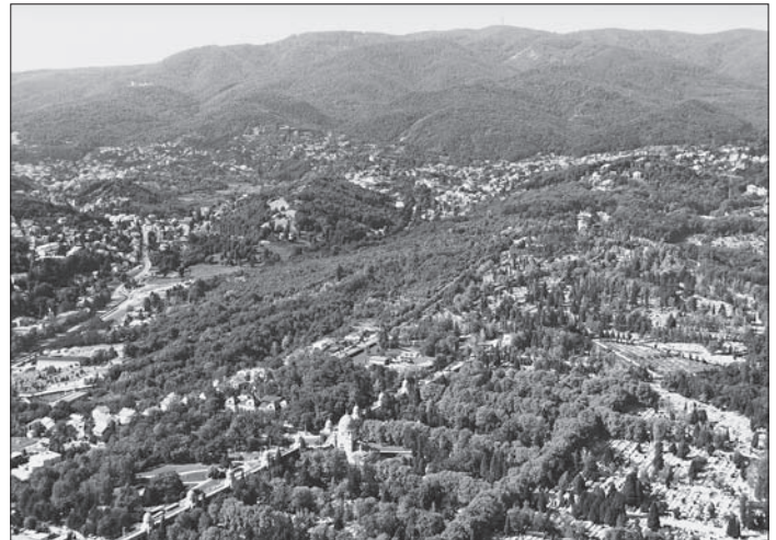
FIG. 4. HILLY LANDSCAPE OF ZAGREB, LJUDEVIT GAJ VILLA AT THE SITE OF THE PRESENT MORTUARY, MIROGOJ (FOREGROUND); VILLA OKRUGLJAK, 2008 (BACKGROUND)

izgrađeno je sedam ljetnikovaca. 27 Nakon administrativnog ujedinjenja grada i stupanja na snagu Građevnog reda dolazi do porasta izgradnje ljetnikovaca pa je u razdoblju od 1857. do 1887. zabilježeno 20 izgrađenih ljetnikovaca, većinom na zapadnom dijelu grada. 28 Za izgradnju zgrada na Josipovcu donešene su polaksice pa su tako od 1888. do 1900. godine izgrađena 44 ljetnikovca. Najviše se gradi u Ulici Gorana Kovačića i Nazorovoj ulici (nekadašnjem Josipovcu) te Tuškancu s Gornjim Prekrižjem. Čak 27 od 33 ljetnikovca na tome predjelu građeno je u to doba. Istodobno se grade tri ljetnikovca na bukovačkom području, a u zapadnom dijelu grada gradi se pojedinačno u ulici, na Svetom Duhu, Vrhovcu i Pantovčaku. 29 Početkom 20. stoljeća grad se postupno širi na bliža okolna područja, a način izgradnje na ljetnikovačkom području postupno prelazi u oblik koji danas nazivamo vilom. Zamjećujemo osjetan pad broja izgrađenih ljetnikovaca. Od 1901. do 1936. izgrađeno je 19 ljetnikovaca. 30 Iako je Generalni regulacijski plan za grad Zagreb iz 1937. godine predviđao izgradnju ljetnikovaca, zabilježena su samo dva primjera. 31