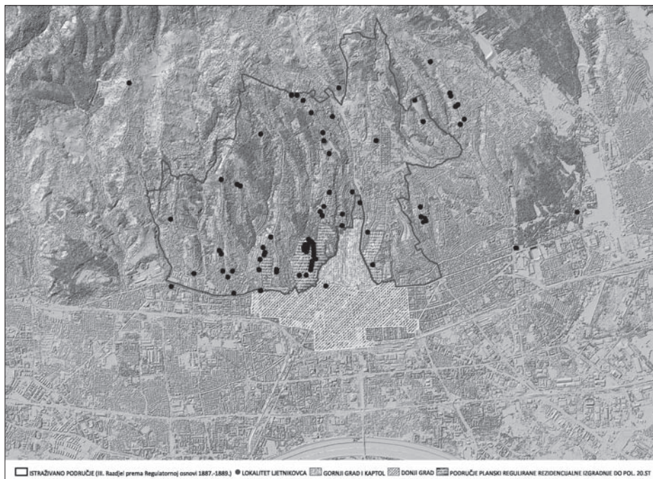
SL. 2. ISTRAŽIVANO LJETNIKOVAČKO PODRUČJE ZAGREBA FIG. 2. THE RESEARCHED VILLA AREA OF ZAGREB

lova počinje novo razdoblje života i razvoja grada. Izradom prve karte grada (tzv. specijalka), zatim prve detaljne katastarske izmjere (1857.-1862.), te donošenjem građevnog reda, stvaraju se preduvjeti za teritorijalno proširenje grada, a time i za povećanje broja stanovnika, što bi omogućilo i povećanje radništva u svrhu gospodarskog/industrijskog razvoja. Povezivanje željeznicom i održavanje prve dalmatinsko-hrvatsko-slavonske izložbe 1864. na tragu su promjena koje će modernizirati grad. Godine 1880. Zagreb je pogodio snažan potres koji je razlogom obnove, ali i zamaha promišljene izgradnje grada. U razdoblju koje slijedi, sve do 1900. godine, donose se propisi za izgradnju zgrada na Josipovcu, gradi se cesta na Josipovcu, otvara perivoj na Tuškancu i u to doba bilježimo najintenzivniju gradnju ljetnikovaca. 9 Iste godine administrativna se površina grada gotovo udvostručuje 10 pa tada Zagreb zauzima površinu od 64,38 km 2 . Zbog sve intenzivnije gradnje na brežuljcima, koju je omogućilo donošenje propisa, donosi se čitav niz regulacija ulica na njima. 11 Druga katastarska izmjera dovršena je 1913., prije početka Prvoga svjetskog rata. Do donošenja nove Regulatorne osnove grada 1937. godine gradnja ljetnikovaca jenjava.