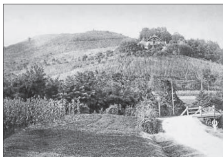
SL. 7. PERIVOJI NA KATASTRALSKIM KARTAMA: LJETNIKOVAC BISKUPA HAULIKA U MAKSIMIRSKOM PERIVOJU (LIJEVO) I LJETNIKOVAC STJEPANA PL. MILETICA U JURJEVSKOJ 29 FIG. 7. PARKS ON CADASTRAL MAPS: BISHOP HAULIK VILLA IN MAKSIMIR PARK (LEFT) AND STJEPAN MILETIC VILLA AT 29, JURJEVSKA ST.