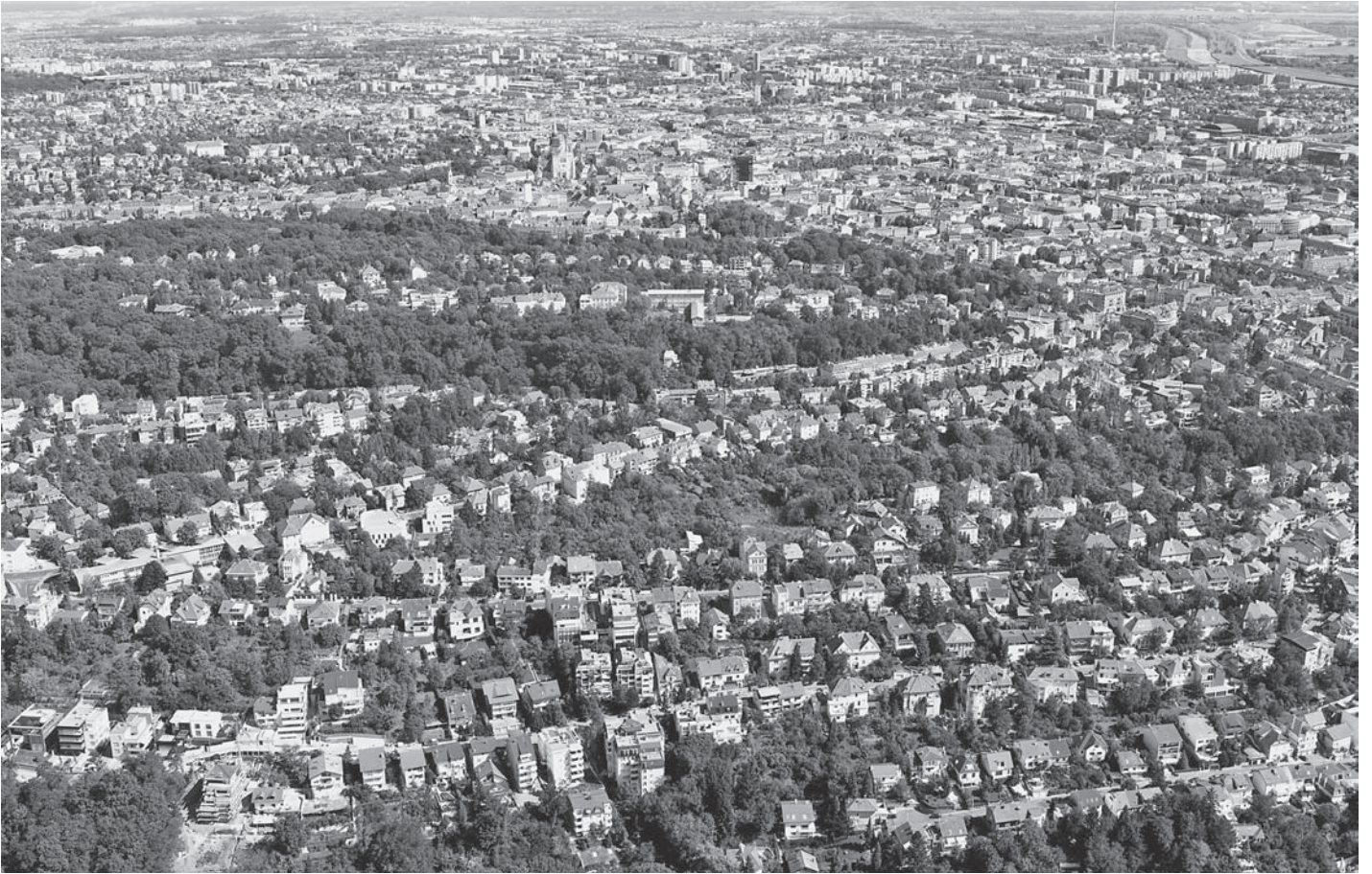
SL. 1. POGLED IZ ZRAKA NA ULICE LJETNIKOVAČKOG PODRUČJA: HERCEGOVAČKA, PANTOVČAK, NAZOROVA, GORANA KOVAČICA, 2008.