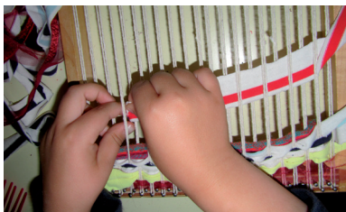
Kompetentnost pripravnika u samostalnom odgojno-obrazovnom radu često određuju neki aspekti stažiranja

naobrazbi (NN, br.10/97), Pravilniku o načinu i uvjetima polaganja stručnog ispita odgajatelja i stručnih suradnika u dječjem vrtiću (NN, br.133/97), Odluci o programu polaganja stručnog ispita za pripravnike u predškolskom odgoju i naobrazbi, Poslovniku o radu povjerenstva za stažiranje odgajatelja i stručnih suradnika u dječjem vrtiću i Poslovniku o radu povjerenstva za polaganje stručnog ispita odgajatelja i stručnih suradnika u dječjem vrtiću (Prosvjetni vjesnik, br.2/00).