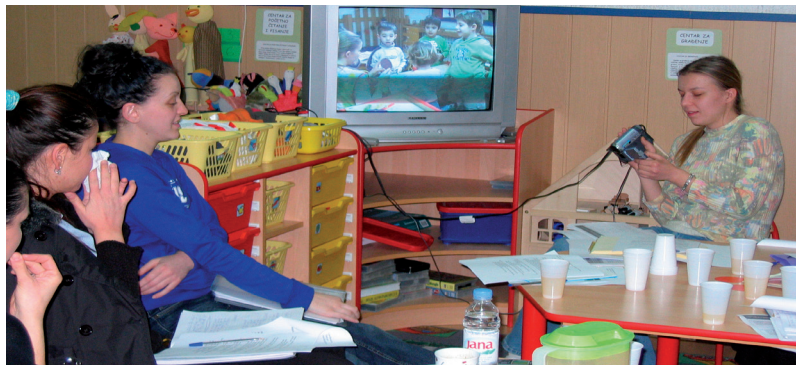
Promišljanje i propitivanje vlastitih odgojnih postupaka svakako će pridonijeti kvalitetnom ostvarenju pripravničkog staža

Ogledne aktivnosti pripravnika u nazočnosti mentora i drugih članova povjerenstva pokazuju kako pripravnik stečena znanja i vještine primjenjuje u neposrednom radu s djecom, a zajednička analiza pisane pripreme i ostvarene aktivnosti pomaže razvoju refleksivnih umijeća pripravnika. Pripravnik se postupno osamostaljuje u realizaciji oglednih aktivnosti: u početku mentor pomaže pripravniku u promišljanju i pripremanju aktivnosti,