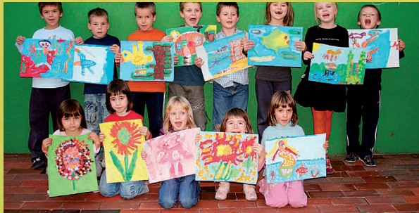
Djeca iz Dječjeg vrtića Pčelica iz Zagreba