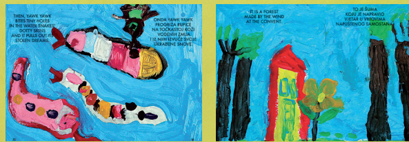
Ulomci iz bajke Zamke četvrtaste šume

Monografiju možete nabaviti u Dječjem vrtiću Opatija. Narudžbu možete izvršiti na broj telefona 051 272 407 i 051 271 665 ili mailom djecji.vrtic.opatija@ri-t-com.hr