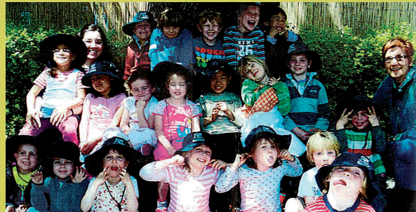
Djeca iz Centra za rani razvoj iz Melbournea

pretočile svoja znanja i vizije u izražaj prepun dječje mašte i kreativnosti.